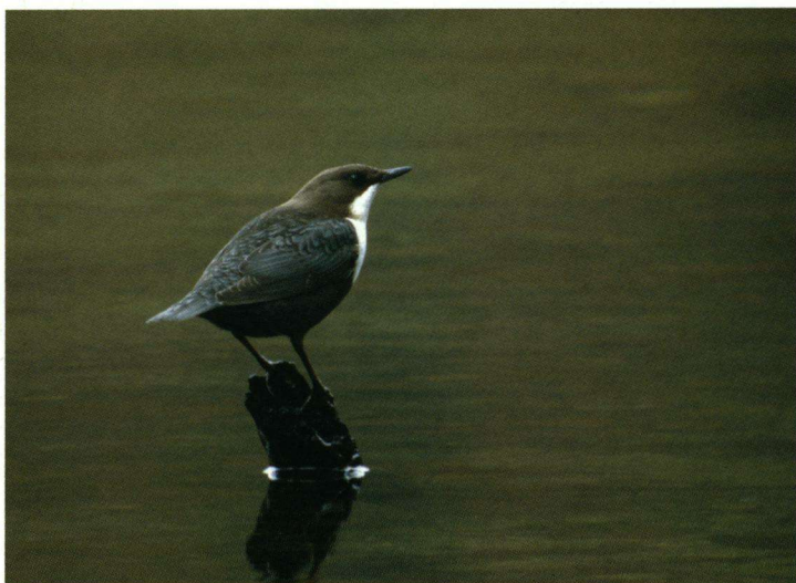
Waterspreeuw Cinclus cinclus , Rozendaal (Gid.), 20 november 2007.