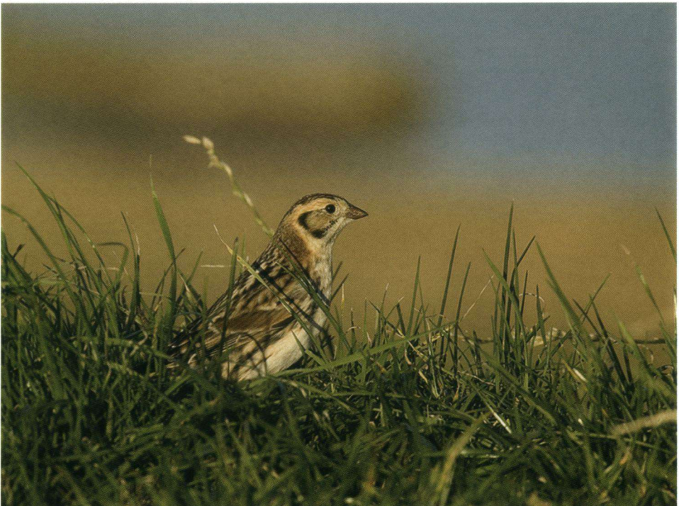
IJsgors Calcarius lapponicus , De Putten (N.-H.), 14 oktober 2007.

06-10-07 1 Eemshaven (Gr.), P. van Wetter.