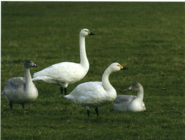
Een familie Kleine Zwanen Cygnus bewickii , Workumerwaard, 16 november 2007.

17-11-07 11 Scharneburen, Wûnseradiel (Fr.). E.W.F. Brandenburg. 17-11-07 2 Ferwoude, Wûnseradiel (Fr.). E.W.F. Brandenburg.