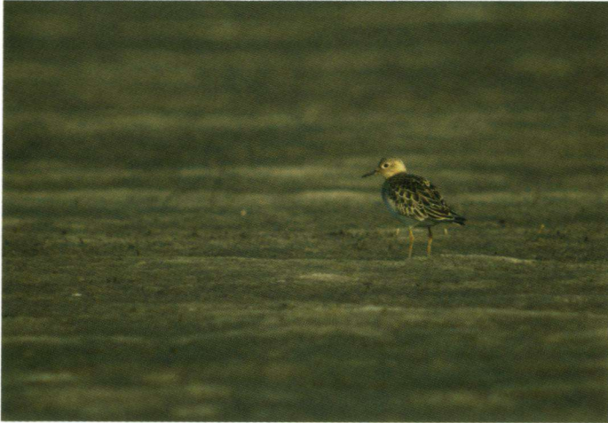
Blonde Ruiterting Tryngites subruficollis , Petten, 6 oktober 2007.