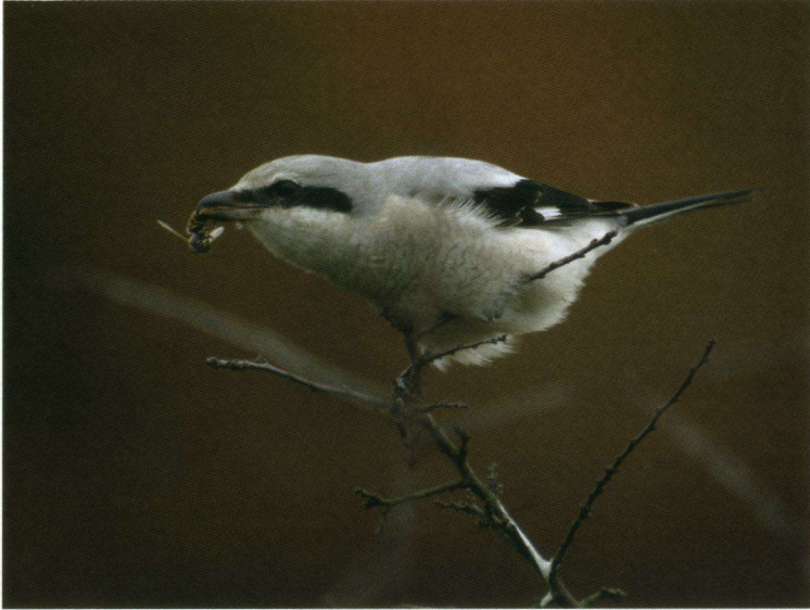
Klapekster Lanius excubitor , Ellecom (Gld.), 30 oktober 2007.