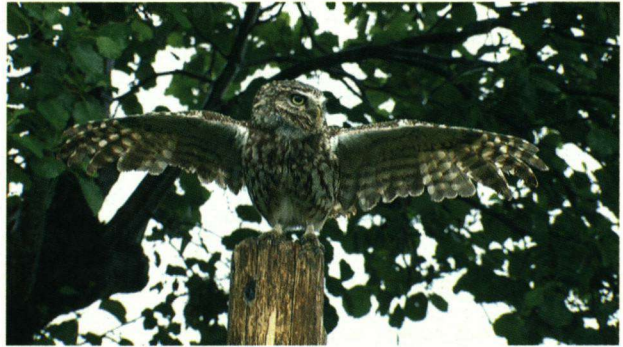
Douchende Steenuil Athene noctua te Eemdijk, 27 mei 2008.

alsof zij een douche nam. Een prachtig gezicht en het regende alsmaar harder. Na enige tijd ging zij hoog in een boom zitten en begon zij zichzelf te poetsen. Het regende toen nog steeds hard. Af en toe schudde zij haar veren. Na een kleine tien minuten vloog zij weg in de richting van een knotwilg. Waarschijnlijk wist zij daar nog een droog plekje.