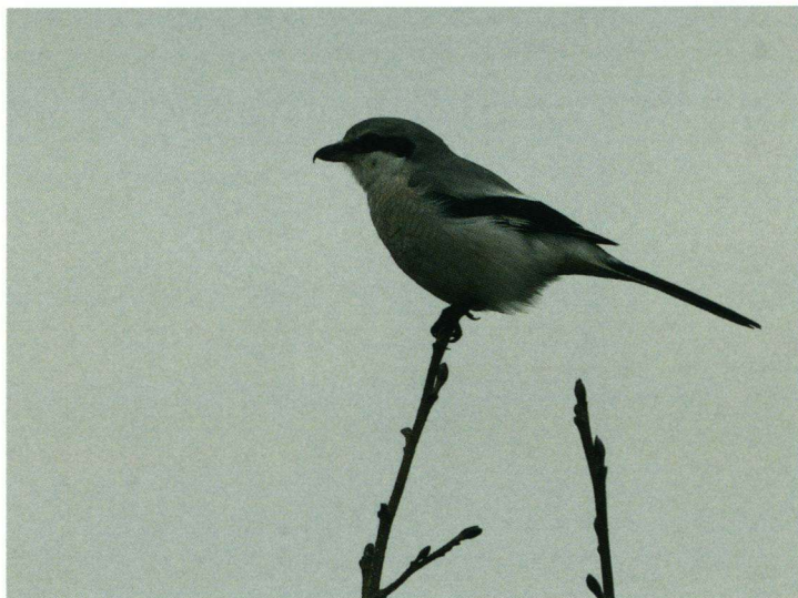
Klapekster Lanius excubitor , Joure, 17 november 2007.