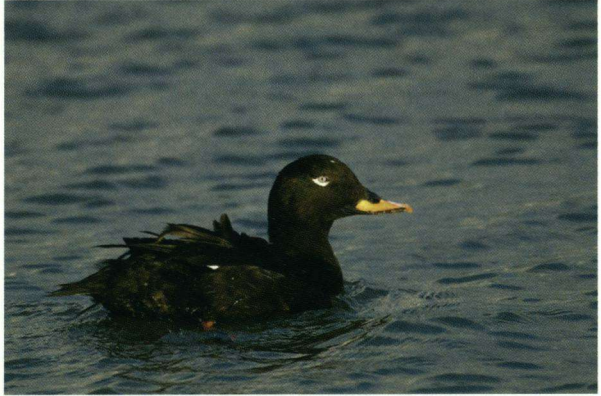
Grote Zee-eend Melanitta fusca , Breezanddijk, 17 oktober 2007.