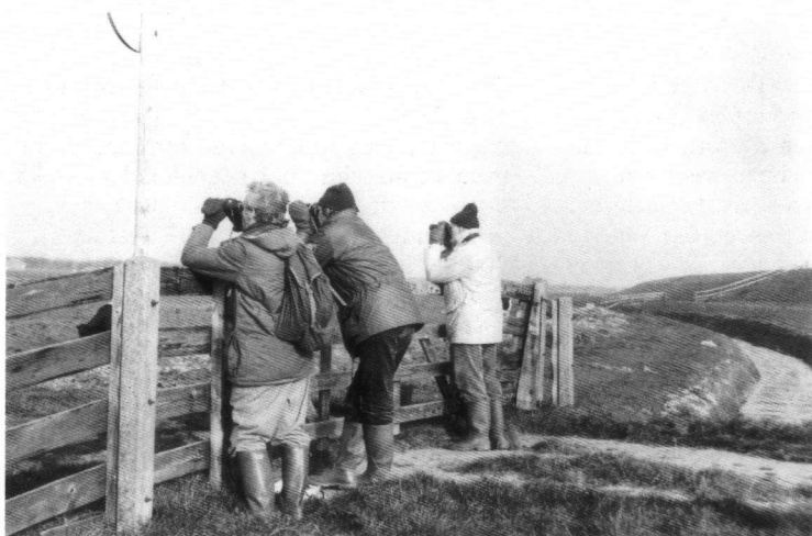
Na 1975 was vogels kijken geen excentrieke en elitaire vrijetijdsbesteding meer. Het werd geleidelijk een volkse, breedge-deelde stroming die zich in de loop der tijd ook van zijn geitenwollensokken-imago begon te ontdoen.

Twee sociologische verschijnselen verdienen ten slotte nog genoemd te worden. Dat is ten eerste de toegenomen welvaart, waardoor wij allemaal meer vrije tijd kregen, die de ANWB met zijn routebeschrijvingen en paddestoelen ons leerde benutten voor tochtjes naar buiten. Ook een gevolg van de toegenomen welvaart – maar minstens evenzeer aangejaagd door de tot op heden voortdurende BTW-vrijdom op vliegtickets – is de populariteit van verre vlieggreizen. Welke vogelaar volstaat tegenwoordig nog met een bezoek aan het Lac du Der? Voor de prijs van anderhalve strippenkaart kun je tegenwoordig al naar Costa Rica! En dan is er zoiets ontstaan als de ‘belevingscultus’: vrijetijdsbesteding moet tegenwoordig actief, nee, interactief zijn, doorspekt met ‘events’. Kuieren door het bos is niet goed genoeg meer, een outdoor excursion moet liefst ’s nachts plaatsvinden en het karakter hebben van een vossenjacht. Welnu, vogelen kan voldoen aan deze nieuwe behoefte en beantwoordt zo nodig aan de gevraagde zucht naar avontuur, spanning en verrassing. Belevingscultus, goedkope vlieggreizen, vrije tijd, meeslepende boeken, natuurfilms en vogelgidsen, optische apparatuur en andere technologieën. Toevallig hebben zij allemaal in het laatste kwart