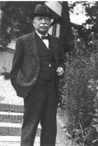
Dr. Jac. P. Thijssse.

Een tweede aanwijzing voor het feit dat er sinds de tweede helft van de jaren zeventig iets moois gebeurd is tussen vogels en mensen, ontleen ik aan mijn eigen ervaringen. In mijn middelbare-schooltijd ben ik een verwoed vogelaar geworden. Iedere vrije woensdagmiddag was ik te vinden aan de oevers van Het Gooi in Nootdorp, waar ik de vogels op en rond deze zandwinningsplas inventariseerde. Ik zag er mijn eerste Visarend! Het was mij op school al opgevallen dat dit echter niet bepaald een vrijetijdsbesteding was waarmee ik bij mijn mede-teenagers veel eer inlegde. Dat werd nog helderder toen ik in 1965 ging studeren: dat ik vogelaar was, kon ik maar beter helemaal niet