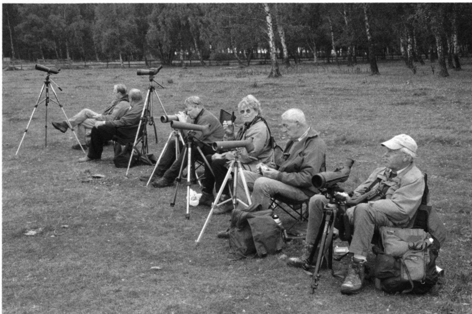
De beschikbaarheid van betaalbare en geavanceerde verrekijkers, camera's, maar tegenwoordig ook internet, mobiele telefonie en automobiliteit behoren tegenwoordig tot de mogelijkheden van vrijwel iedereen. Door dergelijke technieken is het waarnemen sterk verbeterd. Ook is de bekendheid met vogels die zich buiten onze landsgrenzen ophouden sterk toegenomen. Op deze foto een aantal vogelaars bij Falsterbo (Zuid-Zweden) waar jaarlijks drommen vogelaars uit Europa samenkomen om de vogeltrek te bestuderen.

van de vorige eeuw hun heilzame werking uitgeoefend. Zij hebben het vogelen uit de sfeer van 'wereldvreemd' gehaald en gemaakt dat veel mensen zichzelf tegenwoordig vogelliefhebber noemen. Vraag het hun maar eens. En vraag dan gelijk of ze thuis een verrekijker hebben, dan zul je versteld staan van de positieve respons. De vogelliefhebbers kennen ons, vogelaars. Zij weten dat zij niet, maar wij wel, de Wintertaling van de Zomertaling kunnen onderscheiden. De vogelliefhebbers vinden het overigens niet erg. Daar hebben zij ons voor en daarom verlenen zij ons prestige. Zij hebben weer wat anders: zij voeren de vogels, het hele jaar door want dat mag tegenwoordig van Vogelbescherming. Ik schat dat van de negen miljoen huishoudens in Nederland zeker een kwart beschikt over een verrekijker en vetbollen ophangt. Dan hebben we het dus over 2,25 miljoen huishoudens. Dat zijn ruim viereenhalf miljoen mensen! De viereenhalf miljoen vogelliefhebbers vormen een machtig maar werkeloos legioen, zolang wij dat legioen niet aanboren.