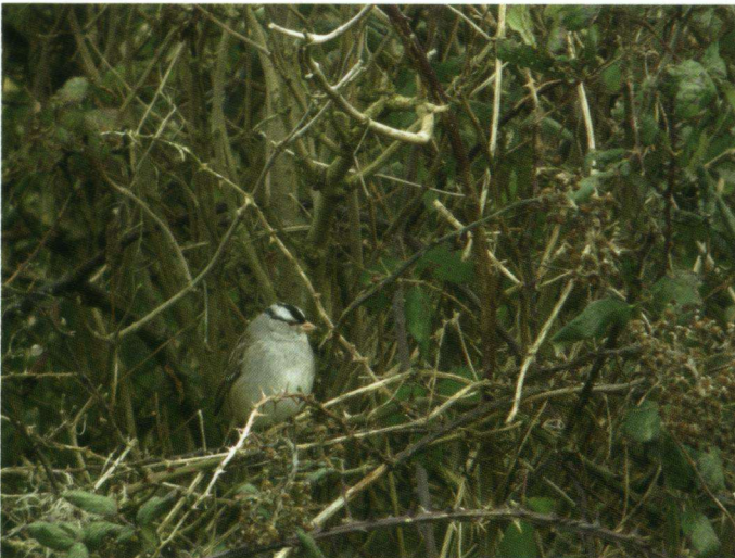
Witkruingors Zonotrichia leucophrys zaterdag 12 januari 2008, Cley Next The Sea, Norfolk, Engeland. Dankzij de aanwezigheid van deze vogel bij de plaatselijke kerk werden uit handen van vogelaars zoveel giften ontvangen dat men inmiddels plannen heeft een afbeelding van de vogel op te nemen in de gebrandschilderde ramen van het kerkgebouw.