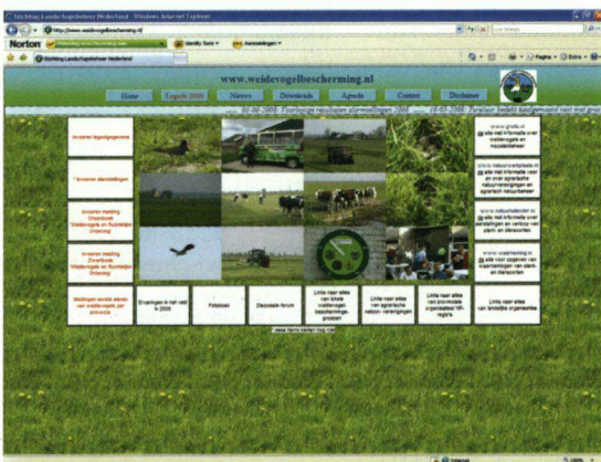
Een informatieve website die geheel gewijd is aan weidevogels en weidevogelbescherming.