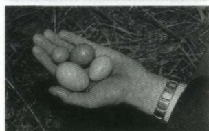
Enkele foto's van het nest dat bezet werd door een Wilde Eend met daarin ook eieren van Wintertaling en Fazant.

Als medewerker aan het vogelpopulatieonderzoek in de Haagse Waterleidingduinen vond ik toen een nest waarin ik eieren aantrof van drie soorten. Dat waren de Wilde Eend Anas platyrhynchos , de Wintertaling Anas crecca en de Fazant Phasianus colchicus . Jammer genoeg zijn mijn aantekeningen uit die tijd verloren gegaan, waardoor ik niet meer weet hoeveel eieren van elke soort in het nest lagen. Wel weet ik dat één van de fazanteneieren erg klein was en naar later bleek alleen een dooier bevatte. Gelukkig zijn van deze vondst wel enkele foto's bewaard gebleven. De eieren werden bebroed door de Wilde Eend, terwijl het vrouwtje Wintertaling op enige afstand van het nest de wacht hield. Voor zover mij bekend zijn de eieren van de Wilde Eend en van de Wintertaling uitgekomen. Die van de Fazant bleven in het nest achter; mogelijk waren die in een te laat stadium gelegd en niet lang genoeg bebroed.