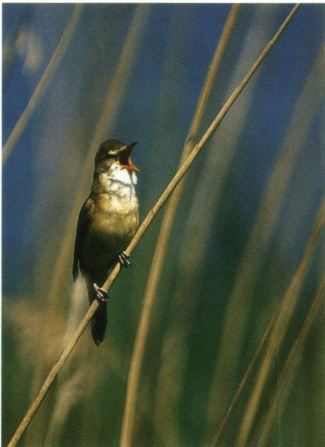
Grote Karekiet bij het Gooimeer. Foto: Jaap Visser.

In mei 2007 werd ik in mijn woonplaats Huizen (Noord-Holland) verrast door een aantal mooie vogelwaarnemingen op het Gooimeer. Als eerste zag ik er op deze zonnige dag groepjes Witvleugelsterns foerageren. In het riet bevond zich echter ook een Grote Karekiet. Deze vogel had een smalle rietkraag in ondiep water uitgekozen. Dit ongepaarde mannetje zong volop en was duidelijk te volgen. In de weekends was het bijna een lokale