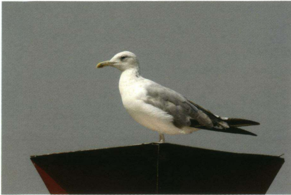
Pontische Meeuw Larus cachinnans , Deventer, 05 augustus 2008.