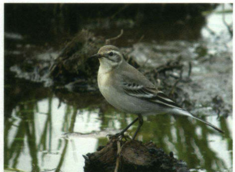
Citroenkwikstaart Motacilla citreola , Ooijpolder, 25 augustus 2008.