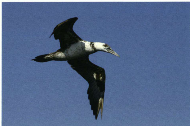
Jan-van-gent Morus bassanus , Ameland, 14 september 2008.