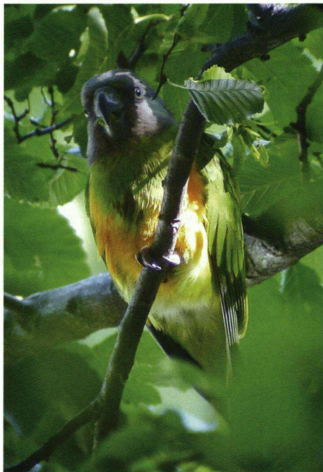
Jong van eerste paar (2007).

Een soort die het echter buitengewoon goed doet, is de Senegalpapegaai Poicephalus senegalus oftewel het 'Bonte Boertje'. Nadat ik in 2006 constateerde dat er twee jongen waren geboren maar niet het exacte broedproces heb kunnen volgen en ook geen foto van de pas uitgevlogen jongen als bewijsmateriaal kon tonen, heb ik de vogels continu geobserveerd. De exacte broedplek is wel gevonden maar helaas kreeg ik van de eigenaren van het terrein niet de gelegenheid om het broedproces en het voedergedrag van nabij te volgen. Op 14 april stelde ik vast dat het paartje was gaan broeden. Verrassend genoeg zijn ook de