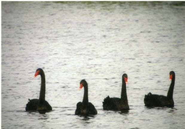
Zwarte Zwanen Cygnus atratus , Zevenhoven, 16 augustus 2008.