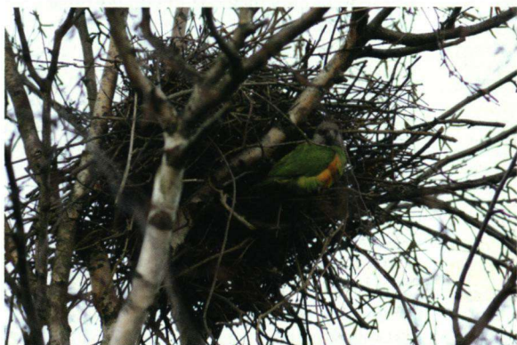
Senegalpapegaai op slaappleats (2007).

Er brak een rustige 'stalk'-tijd aan. Het uitvliegen van de nieuwe jongen werd verwacht na 23 juli. Op 8 augustus kreeg ik van een dame die nabij het foerageergebied woont en met wie ik regelmatig contact heb, een berichtje dat er een jonge Senegalpapegaai was gezien. Tussen 8 en 28 augustus kon het jong regelmatig worden waargenomen; het verraadde zich veelal door een eksterachtig geluid. Door hun goede camouflagekleuren zijn de