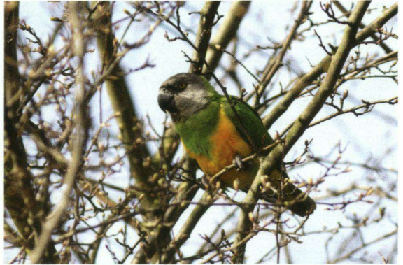
Mannetje van het eerste paar (2006).

Senegalpapegaaien nagenoeg niet te vinden tussen de geelgroene bladeren. De ouders en de drie jongen (twee uit 2006 en één uit 2007) sliepen nog steeds bij de nestplaats.