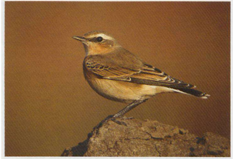
Tapuit 25 september 2008.

05-08-08 1 Oosterscheldekering - Neeltje Jans - West (Zld.). H. Walraven.