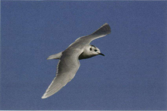
Dwergmeeuw september 2008.