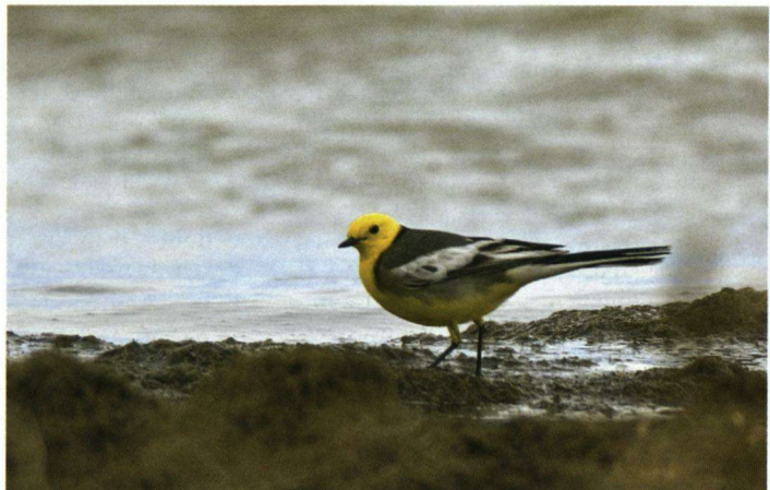
Citroenkwikstaarten zijn vogels van vochtige, grazige plekken langs meren en rivieren in het steppe-gebied.

Dit meer bereiken wij eind mei na een lange, ruige tocht. Het is een dag met zeer harde wind, felle regenbuien en veel zand en stof! Wij komen verscheidene keren vast te zitten in het stuivende zand. Het bericht heeft ons tijdens onze tocht al bereikt dat het meer grotendeels droog staat. Wij koersen af op het meest westelijke deel van het 30 km lange en circa 5 km brede meer, waar nog wel water blijkt te staan. Het ligt er bij opklarend weer en met op de achtergrond de besneeuwde Altai-bergketen schitterend bij. Wat opvalt, ook bij de andere meren, is dat zij – voor zover wij een beeld krijgen van de zeer grote meren – begeleid worden door brede glooiende oevervlaktes die drassig zijn en een uitgesproken groene, kortgrazige vegetatie dragen. Het drassige karakter is stellig afkomstig van kwel van hogere delen en van kleine rivieren en stroompjes die naar de meren afvloeien. Duidelijk is dat de groene vlaktes dankbaar graasgebied vormen voor de grote kuddes vee van diverse pluimage. Wij zien dan ook overal in de onmetelijke vlaktes gers, overigens op heel grote afstanden van elkaar gelegen.