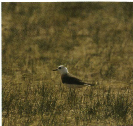
De Steppeplevier: een fascinerende steltloper van de kale steppe.

Zoals al eerder gemeld wordt het uitgestrekte steppe- en woestijnareaal regelmatig doorsneden door grote en kleine rivieren. Een paar keer rijden wij tijdens onze tocht langs en door uitgestrekte riviergebieden die vanzelfsprekend door hun vochtige karakter een andere flora en fauna herbergen dan het droge steppe- en woestijnlandschap. Ook leveren zij door hun rijkere vegetatie relatief veel voedsel voor de omvangrijke kuddes en ze zijn daardoor favoriete graasgebieden. Hier en daar zagen wij ook akkerbouw waarbij – ook in Mongolië – water uit de rivier wordt afgetapt dat niet bevorderlijk zal zijn voor de waterhuishouding van