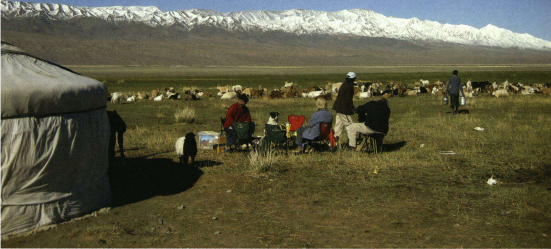
Oevervlakte langs het steppemeer Orog Nuur. Dit is de habitat van onder meer de Grote Pieper en de Citroenkwikstaart.

Een reis per trein door Siberië en per auto door Mongolië