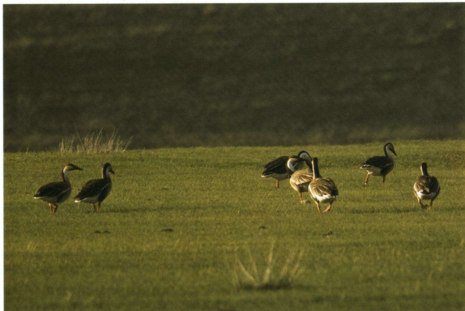
Zwaanganzen zijn een regelmatige verschijning bij steppemeren.

stroomafwaarts gelegen gebieden. De vlakke nagenoeg boomloze riviervlaktes zijn onvoorstelbaar rijk aan leeuweriken, waarbij de ons zo bekend klinkende Veldleeuweriken, naast Mongoolse Leeuweriken en Mongoolse Kortteenleeuweriken, niet ontbreken. Op een plek, waar wij, terwijl onze chauffeur op zoek ging naar een goed doorrijdbare plek, noodgedwongen – in verzengende warmte! – geruime tijd verbleven, noemde ik, behalve leeuweriken: Casarca,