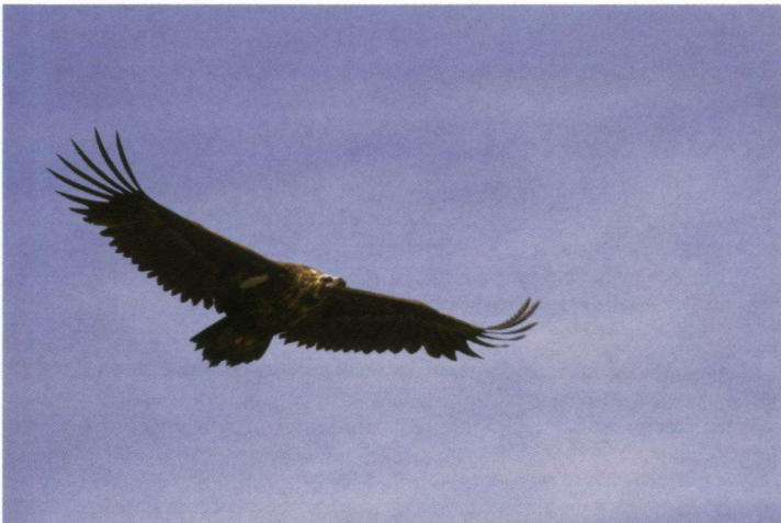
De Monniksgier is een dagelijkse verschijning in het steppegebied. Soms in flinke aantallen.

Het meestal zwak glooiende steppe- en woestijngebied – dat tijdens onze tocht in onze ogen onbegrensd is – wordt doorsneden door grote en kleine rivieren. In de nabijheid van de rivieren en langs de oevers van de vele grote en kleine meren