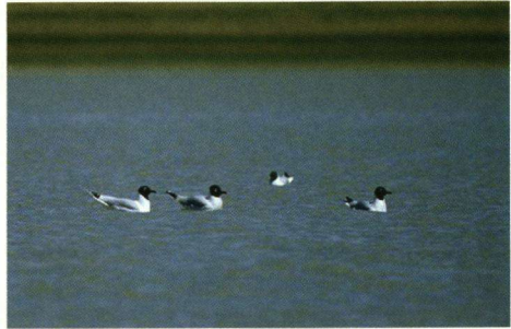
Relictmeeuwen bij het steppemeer Orog Nuur. Deze soort werd enige decennia terug nog als uitgestorven beschouwd.

Wij ervaren de beruchte, snelle afwisseling in weertypen. Is het de ene dag zonnig en zeer heet, de dag erop kan het stormen en hagelen en zeer koud en stoffig zijn! De gers bieden dan heerlijke beschutting en de hete kamelethee (en soms ook wodka), ons altijd bij onze kennismaking met de nomaden aangeboden, gaven evenzeer