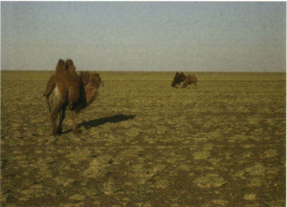
Grote grazers op de steppe.

Op 19 mei komen wij 's morgens exact op tijd in Irkutsk aan, op ongeveer 40 km van de zuidelijke punt van het Baikalmeer gelegen. Het weer is ook hier prima: zonnig en vrij warm. De stad straalt nog het karakter uit van het welvarende centrum voor handel, met vooral China, dat het tot ver in de vorige eeuw nog was. Naast de Sovjetflats uit later tijd, zijn er