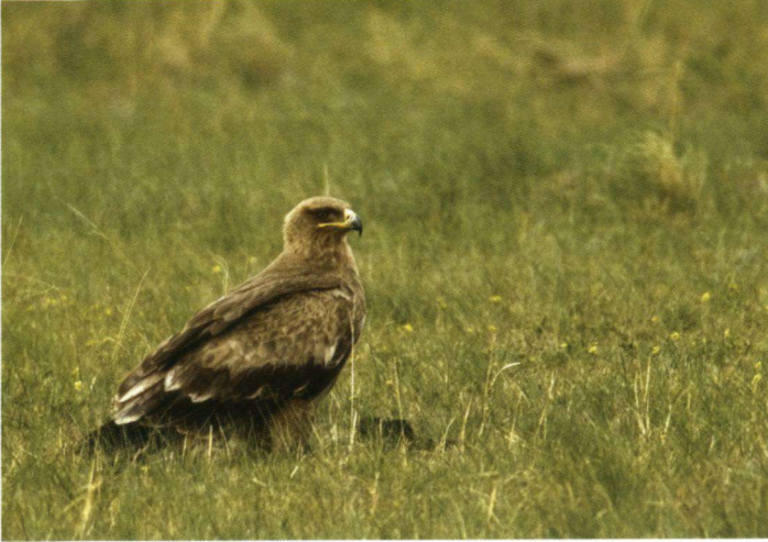
De Steppearend is een niet alledaagse verschijning. De soort vertoont een afnemende trend.

De tocht loopt eerst nagenoeg zuid in de richting van de Chinese grens om daarna in westelijke richting af te buigen naar een tweetal befaamde meren. Vandaar gaat het noordoost naar een derde meer en het Hustai-park (Przwalskipaarden) dicht bij Ulan Batar, om ten slotte te eindigen in het Terelj Nationale Park ten noordoosten van de hoofdstad.