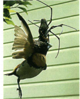
Een Bruinborstrietvink is ten proef gevallen aan een Australische spin.

uk/earth/main.jhtml?view=DETAILS&grid=&xml=/earth/2008/10/22/easpider122.xml ) toont een foto van een forse spin die een Bruinborstrietvink Lonchura castaneothorax gepakt heeft. Deze Australische vogelsoort – daar bekend onder de naam 'Chestnut-breasted Mannikin' – is ongeveer 10 cm groot.