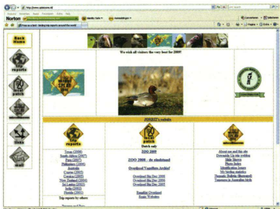
De website van de reislustige Simon Plat.