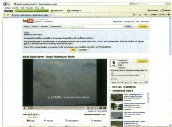
Op YouTube staan nog steeds beelden van de vogeljacht op Malta.

Hanneke Huiskamp meldt in een e-mail op 10 oktober 2008: 'Het lijkt erop dat een vliegtuigmaatschappij een methode heeft bedacht om de kredietcrisis het hoofd te bieden. Of gaat het nu normaal worden dat vogelringers verantwoordelijk gesteld gaan worden voor schade? De NOS bericht het volgende: Een duivenmelker uit Wallonië wachtte twee dagen lang op zijn duif die voor een wedstrijd was losgelaten, maar het dier kwam niet