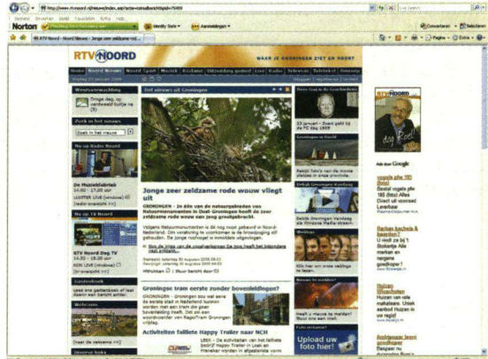
De website van RTV Noord geeft informatie over een uitgevlogen Rode Wouw.

Op http://www.telegraph.co.uk/news/picturegalleries/earth/2522622/Seal-catches-and-eats-duck.html?image=3 is te zien dat