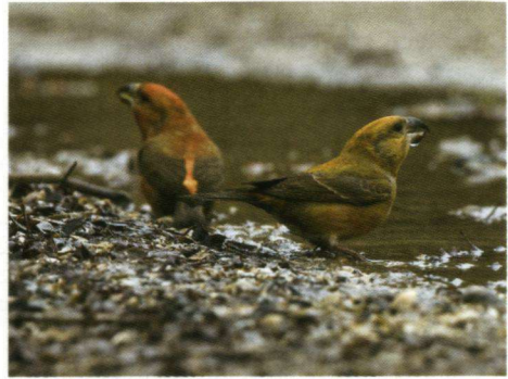
Grote Kruisbekken.

Ander voedsel als zaden nemen ze bijna niet. Door hun vergaande voedselspecialisatie hebben de Kruisbekken al snel de aandacht getrokken van wetenschappers. Dankzij hun speciaal aangepaste snavel zijn ze in staat om het zaad uit kegels van naaldbomen te halen. Omdat dit voedsel weinig vocht bevat moeten ze regelmatig naar een plasje om te drinken. Die kennis kwam mij als vogelfotograaf goed van pas. Goed verdekt zitten bij wat water of bij een bestaand plasje en dan maar afwachten. Gelukkig werd het wachten beloond. Het blijkt dat ze tijdens het foerageren en drinken niet erg schuw zijn. Er vlogen er een negental rond die allemaal even kwamen drinken. Dan kan het uren duren voordat ze weer terugkomen om te drinken. Hun aanwezigheid heeft vaak een invasieachtig voorkomen. Het normale broedgebied bevindt zich in Scandinavië en Europees Noord-Rusland, maar door voedselgebrek kunnen ze gaan trekken. Soms blijven er een paar hangen en dan is het niet uit te sluiten dat ze hier ook broeden. Dat doen ze al vroeg in het voorjaar en soms al in januari. Voorwaarde is voldoende (zaden) voedselaanbod. Van