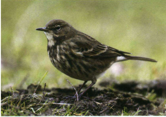
Deverpieper Anthus petrasus , Veenoord-kolk, Deventer, 2 december 2008.

25-10-08 1 Heeg (Fr.). E.W.F. Brandenburg. 15-11-08 1 De Groene Ster, Leeuwarden (Fr.). M. Stienstra.