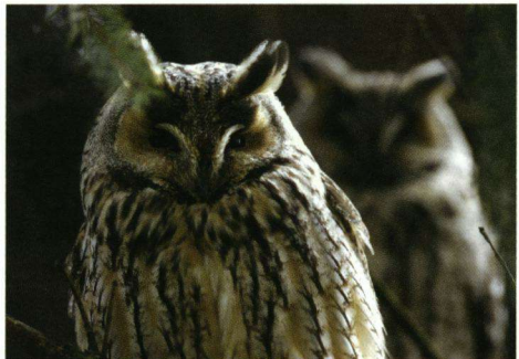
7 januari 2008 's ochtends. Twee van de maximaal 32 Ransuilen die in de winter van 2007/2008 samen met een Velduil roestten in een vijftiental coniferen, meest sparren, in de tuinen en het openbaar groen tussen de Veldweg en de Oosterstraat in Gendringen.

De Gendringse Velduil werd op zondag 30 december 2007 ontdekt door vogelaars Jo Hermans en Tom Zeegers. Zij waren op een melding van een groep Ransuilen in de tuinen en het openbaar groen tussen de Veldweg en de Oosterstraat op de website Waarneming.nl afgekomen en stuitten tot hun verrassing bij het afspeuren van de sparren en andere coniferen behalve op tien Ransuilen ook op een Velduil. Na hun melding hiervan op Waarneming.nl liep het de dagen daarna storm met geïnteresseerde vogelaars, van wie een deel ook weer hun waarneming en soms foto op de site zette. Zo is ook te zien dat op 1 januari 2008, behalve weer de Velduil, niet minder dan 32 Ransuilen werden gemeld. Ikzelf toog, verleid door mooie foto's van Erik de Waard op de website van de Vogelwerkgroep Arnhem, op 7 en 8 januari naar Gendringen en kon de uilen op beide dagen goed bewonderen en fotograferen. Op 7 januari om 9.45 uur 's ochtends zat de Velduil apart, vrij hoog in een ongeveer twaalf meter hoge Fijnspaar. De dichtstbijzijnde Ransuilen zaten in een sparrengroep een meter of vijftientig verderop. Terwijl de Ransuilen zaten te suffen, was de Velduil klaarwakker en alert en zat hij, zich soms rekkend en strekkend om het beter te kunnen zien, met veel belangstelling naar een groep tsjilpende Huiswassen even verderop te kijken. De volgende dag op ongeveer hetzelfde tijdstip zat hij iets lager, meer verstopt in