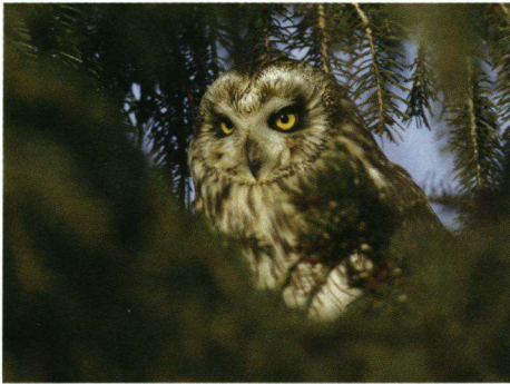
Op 7 januari 2008 tegen tien uur 's ochtends zat de Velduil heel wakker en alert in het zonnetje om zich heen te kijken, onder meer naar een groepje Huiswassen even verderop.

■ Rein Schut, Timorstraat 38, 7941 VE Meppel, (0522) 25 29 62.