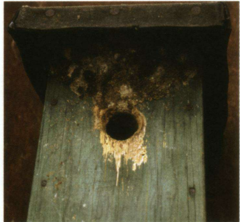
Een nestkast die door een Boomklever was 'opgeknapt' met behulp van mest van runderen.

Wanneer het metselwerk van de Boomklever beschreven wordt heeft men het over klei, leem en modder of over combinaties daarvan vermengd met speeksel. Toen ik eens zo'n kastje waarin Boomklevers genesteld hadden voor