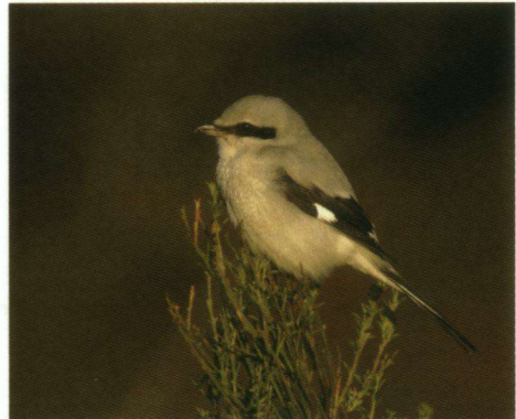
Klaapekster Lanius excubitor , Het Gooi, 27 oktober 2008.

10-10-08 1 Dahliastraat, Enschede (Ov.). C. Derks. 11-10-08 1 Haaksbergerveen & Buurserveen natuurreservaat (Ov.). C. Derks.