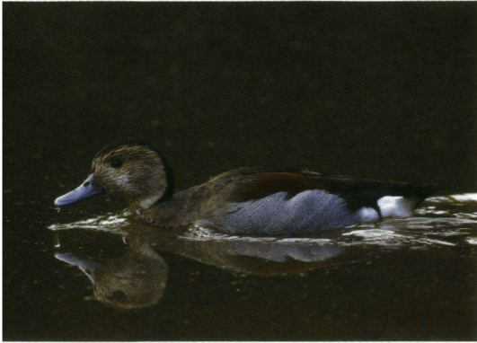
Roodschouderaling Callonetta leucophrys , Lookersdijkkolkje, Deventer, 11 oktober 2008.