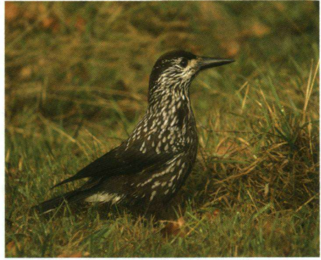
Notenkraaker Nucifraga caryocatactes , Horst, 25 oktober 2008.

15-11-08 1 Schoorlse Dunen - Strandpaal 29 (N.-H.). P. van Rijsinge & F. Kalsbeek.