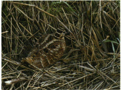
Hootsnip Scolopax rusticola , Hondsbossche Zeewering, Camperduin, 2 november 2008.