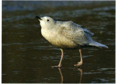
Kleine Burgemeester Helder, 29 december 2008.