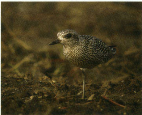
Zilverplevier Pluvialis squatarola , Duivensche Broek, Duiven, 6 oktober 2008.