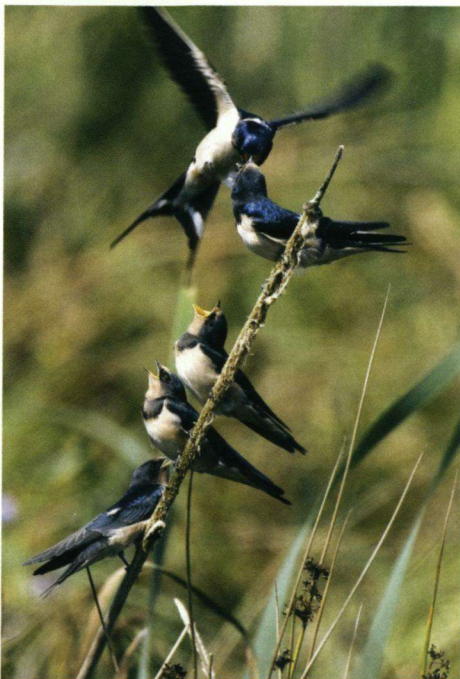
Boerenzwaluw die jongen voert. Deze opname scoorde heel hoog, maar moest wijken uit de selectie voor de foto van de Roodborst op berijpte takken, die van dezelfde fotograaf was.