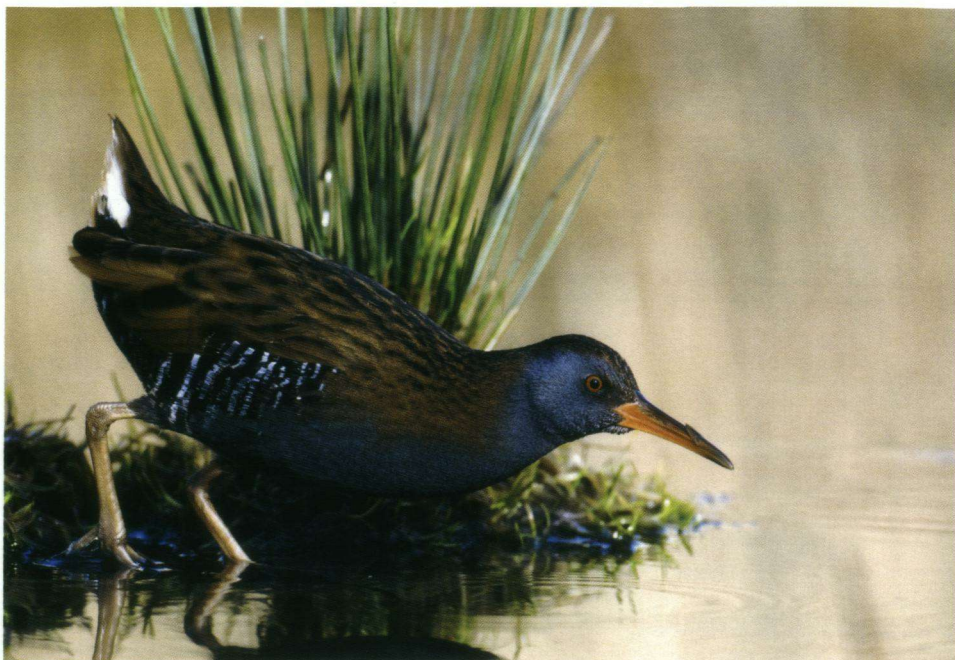
Derde Prijs – Waterral bij Vlaardingen, maart 2008.