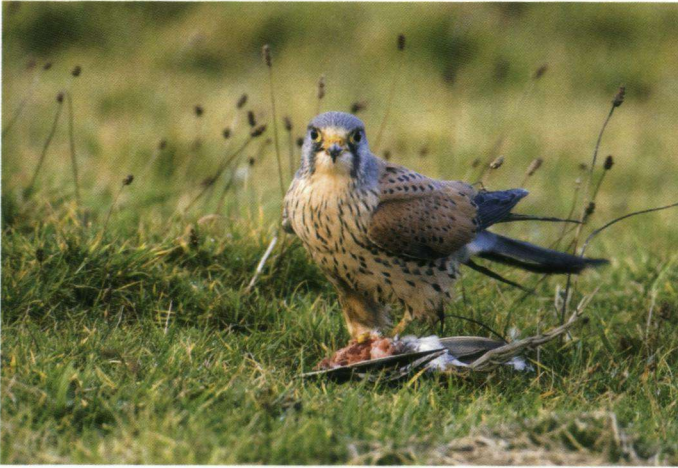
Eervolle vermelding – Mannetje Torenvalk met een prooi.