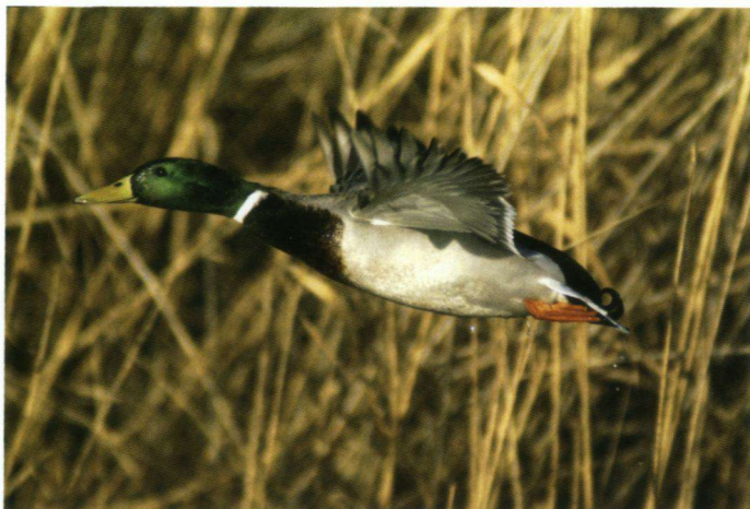
Vliegende woerd bij het Apeldoornsch Kanaal te Hattem.