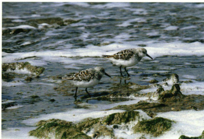
Eervolle vermelding – Een fraaie plaat van Drieteenstrandlopers in de branding.