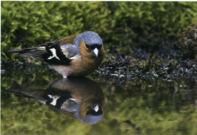
Eervolle vermelding – Vink neemt bad.