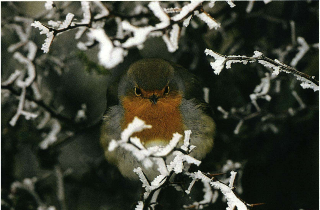
Tweede Prijs – Roodborst in de winter.