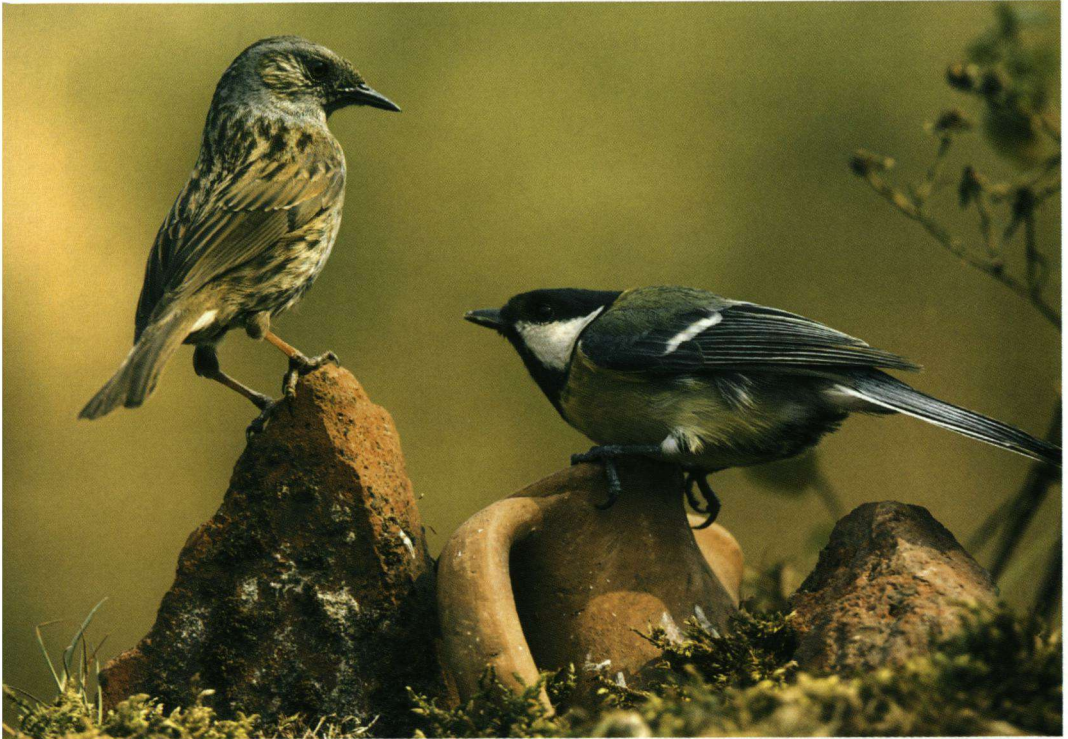
Eerste Prijs – Heggenmus en Koolmees op steen en aardewerken pot in de 'Reuselse Moeren' op 23 april 2008.