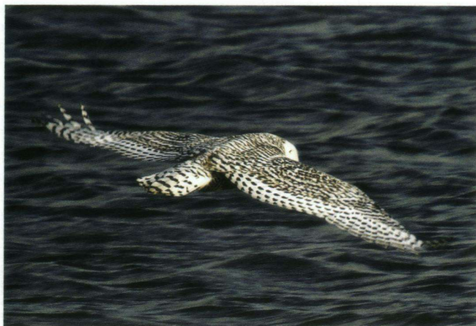
Sneeuwuil vlegend over het water bij Texel. Hoewel deze foto de tweede ronde net miste trok hij veel aandacht.

Koolmees dreigend aan te kijken. Deze lijkt een beetje schuw weg te duiken. Een ander jurylid waardeerde de foto vooral omdat het 'een superscherpe opname' was.