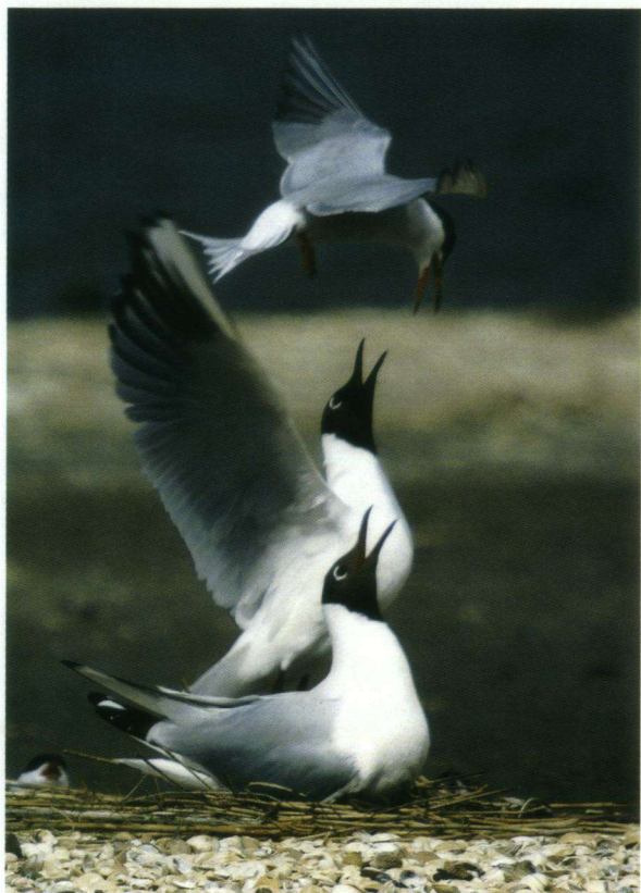
Vierde Prijs – Kokmeeuwen bij 'De Petten' Texel.