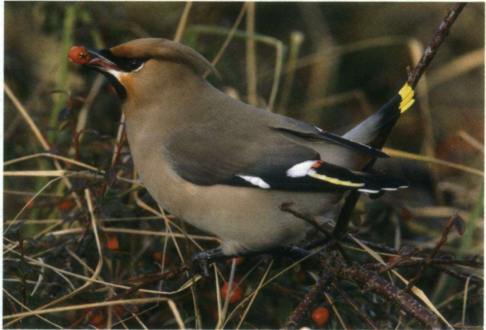
Eervolle vermelding – Pestvogel.