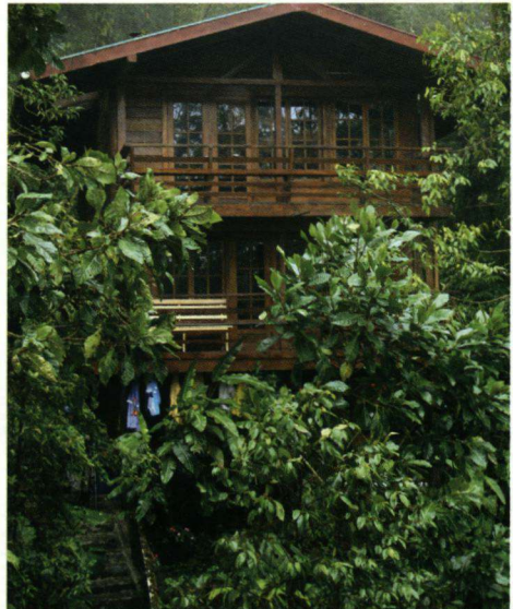
In Amistad National Park zijn een paar hutten die goed geschikt zijn voor het waarnemen van vogels. Je kunt er overnachten of een dag rondbrengen om vogels te zoeken en te zien.

Na aankomst in Panama Stad vertrekken we naar Park Eden waar we in een bijna sprookjesachtige omgeving dineerden en overnachtten. Park Eden is gebouwd en ingericht in een mengeling van Spaanse en Victoriaanse stijl, waarbij werkelijk aan de kleinste details grote zorg is besteed.