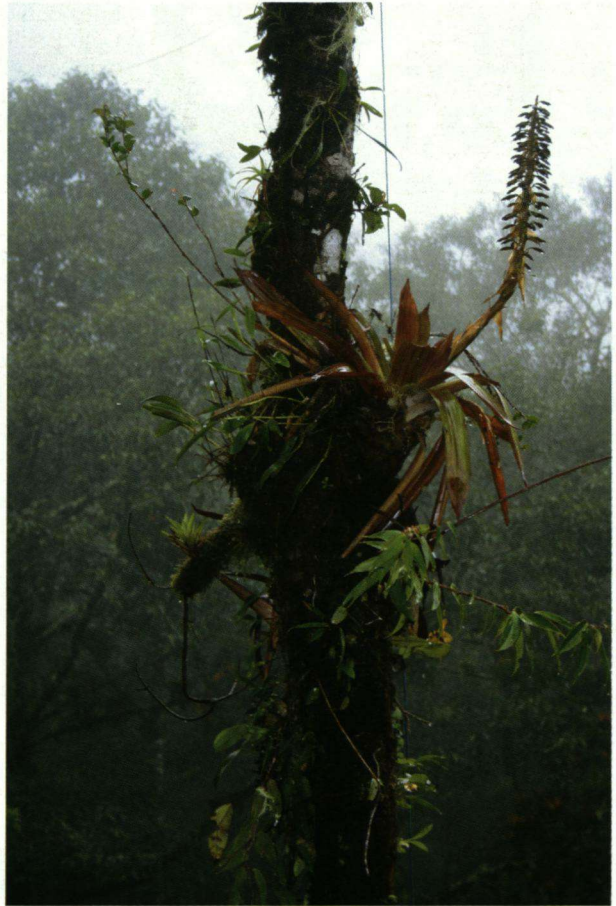
Kenmerkende begroeiing van boomstammen met epifythen, vooral bromeliasoorten in het nationale park Amistad.

in de provincie Chiriquí. Onderweg zien we regelmatig een Zwarte Gier vliegen en op menige telefoonpaal zit een Tropische Koningstiran. In Los Quetzales volgt een echt ontbijt, dat steeds onderbroken wordt om een nieuwe vogelsoort waar te nemen. De Roodkraaggers, de Groene Violetoor-