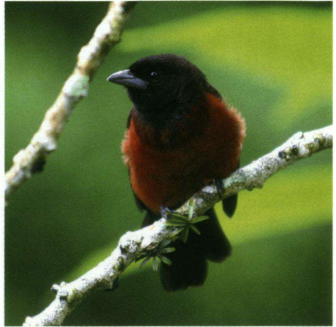
De Roodrugtangare Ramphocelus passerinii is een opvallende verschijning met zijn helder rode kleuren. Hier is een vrouwtje afgebeeld.

Na een korte nachtrust gaan we vol goede moed 's ochtends vroeg met een bus naar de bossen van Cerro Gaital. Het is een afwisselend landschap met heuvels, open en heel dichte bossen, afgewisseld met grasland en akkertjes. Onderweg laat de gids de bus telkens maar weer stoppen op plekken waar je zo op het oog niet veel verwacht. Zo worden de volgende soorten ons deel: Groefsnavelani, Wegbuizerd, Zwarte Buizerd, Roodkruinspecht, Rooddijtpit en Roodkruintiran. We stoppen telkens voor vogels, maar ook de colonnes bladsnijdermieren, die hele paden plattrappen, fascineren ons, net als de bloemenzee. Eén soort bloem valt erg op, met twee rode schutbladen getooide bloemen, gelijkend op twee vuurrood gestifte lippen, draagt deze de toepasselijke naam 'hotlips'. We moeten onwillekeurig even aan de bekende tv-serie 'MASH' denken. Ook watervogels vinden we in verspreide poelen, zoals Amerikaanse Oeverloper, Grote Zilverreiger en de Amerikaanse Zilverreiger. Af en toe zeilt een Amerikaanse Fregatvogel voorbij. De zee is hier nooit ver weg. We rijden terug naar Park Eden. De tuin blijkt hier een vogelparadijs. Gedurende de lunch die we daar gebruiken, zien we voortdurend de Gebandeerde Mierklauwier en verder de: Goudbuiksmaragdkolibrie, Verreaux' Duif, Steenduij, Zwartborstgaai, Roodrugtangare, Zwarte Tangare, Palmtangare, Bruinkaporganist, Tennesseezanger, Huiswinterkoning, Bont