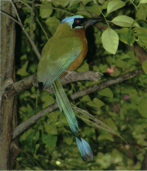
De Blauwkapmotmot Momotus momota is een soort van bosranden en secundair bos. Motmots behoren tot een familie van vogels uit de orde van Scharrelaarvogels.

■ K. van Berkel, Tebinckslaan 14, 9462 PV Gasselte, e-mail: tvb@blue-elephant.nl.