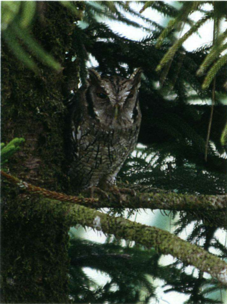
Cholibaschreeuwil Otus choliba is een veel voorkomende kleine uil.

kolibrie en de Violette Sabelvleugel – ook een kolibrie – leren we al snel kennen. Ook zien we de Mexicaanse Berghoningkruiper, een honingzuiger die vals speelt door achter in de bloemen gaatjes te prikken om bij de nectar te komen. Zo ongeveer als bij ons de koekoekshommels dat doen.