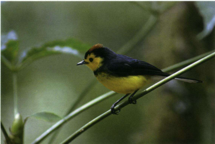
Halsbandzanger Myioborus torquatus . Deze soort is endemisch in Midden-Amerika.

Dikbekje en Baltimoretropiaal. In de middag maken we ons met moeite los uit dit vogelparadijsje en beginnen aan een wandeling in de omgeving. Niet voor niets: Wegbuizerd, Toviparkiet, een groepje Blauwe Suikervogels, Westelijke Bospiewie, Suikerdiefje, Grijsborstpurperzwaluw, Boerenzwaluw. Voortdurend worden we in de gaten gehouden door Tropische Koningstiranen, die qua gedrag wat lijken op de Bijeneters in de Oude Wereld. Maar het hoogtepunt van de wandeling is het moment, dat iemand een vreemde witte vlek in de bossen op een berghelling ziet. In een spurt wordt teruggerend naar de lodge voor een telescoop. Gelukkig blijft