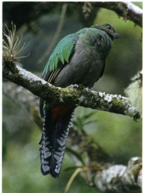
Quetzal-vrouwtje Pharomachrus moccino .

De volgende dag trekken we al vroeg met Landrovers het nationale park in. Dit is