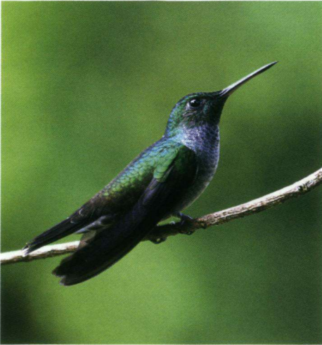
De Bronsstaartpluimkolibrie Chalybura urochrysis is een tamelijk zeldzame kolibriesoort.

koning en Langstaarttroepiaal Quiscalus mexicanus ( Cassidix m. in Ridgely). 's Middags bezoeken we het Metropolitan Nature Park. Dit is een droog loofverliezend bos dat deel uitmaakt van Panama Stad, maar van dat laatste merk je niet veel in het bos. In deze bossen zien we weer heel andere soorten, zoals Witbuikmiervogel, Gele Zanger, Lancetmanakin, Gray's Lijster, Witschoudertangare en Spix' Piewie. Vooral het zoeken naar de manakin is een lastige klus. Zo mooi als ze zijn, zo lastig zijn ze te zien, maar gelukkig verraden ze zich regelmatig met hun raspande vleugels. Deze zeer ken-