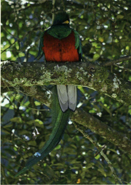
Quetzal Pharomachrus mocino . Quetzals zijn zeer tot de verbeelding sprekende vogels uit de orde van de trogons. Deze orde beperkt is tot de tropen. In Indiaanse culturen speelt de Quetzal een belangrijke rol.

tijdens onze reis het enige gebied waar we een echt slechte weg treffen. Al snel wordt de weg zo slecht, dat we te voet verder gaan naar een op korte afstand gelegen lodge. Deze lijkt vooral op een groot uitgevallen observatiehut met een slaapkamer en een houtkachel. Dankzij de uitgebreide veranda's is het hier ook tijdens de buien goed vogelen en we kunnen er diverse soorten noteren. Dat gaat overigens niet gemakkelijk, want er zijn zoveel nieuwe soorten dat er nauwelijks tijd is om te schrijven. Het begint met Geeldijstruikgors en Grootpootstruikgors al snel gevolgd door Geelflankzijdevliegenvanger, Roodbrauwpeperklauwier, Zwartbruine Pievie, Tandsnavelbaardvogel, Zilverkeeltangare. De bomen in het nevelwoud zijn dicht begroeid met zowel mossen en epifyten, zoals bromelia's. Deze hebben een eigen lijst van de vogelsoorten die zich op deze biotoop gespecialiseerd hebben, zoals de Rode Boomloper en Vlekkruinmuisspecht.