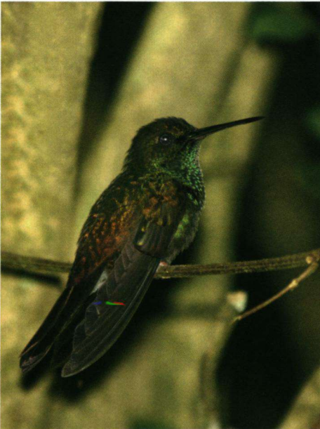
De Blauwborstamazilia Amazilia amabilis is een kolibrie die vaak tuinen bezoekt. Van nature komt deze soort in laagland voor.

Totaal vermoeid zak ik 's avonds weg in een 'Emperor-size' bed. De volgende ochtend word ik erg vroeg en wreed gewekt door de wekker. We gaan de