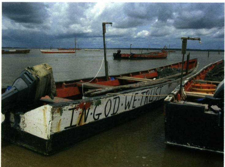
Vissersbootjes bij Braampunt. Op één van de bootjes staat de tekst 'In god we trust' geschilderd.

gerestaureerde plantage Frederiksdorp aan de rivier de Commewijne. De huizen zijn hersteld, de plantage grotendeels onderhouden en het is zelfs mogelijk er te logeren. We besluiten daar vier dagen door te brengen. Frederiksdorp is alleen per boot bereikbaar en de fietsen gaan mee. Het lijkt mij een 'diamanten stek' voor vogelaars. Een Vale Reuzennachtzwaluw Nyctibius grandis zat in een berkachtige boom. Hij was nauwelijks te vinden want zijn verentooi en vorm zijn kwamen goed overeen met de kleur en structuur van de stam waar hij tegenaan zit. De mooiste en vreemdste soorten spechten, waaronder ook kleinere soorten, houden zich op bij Frederiksdorp. Verder ook de Krabbenbuizerd Buteogallus aequinoctialis , Vaalborstlijjster Turdus leucomelas , groepen Kleine en Grote Ani's