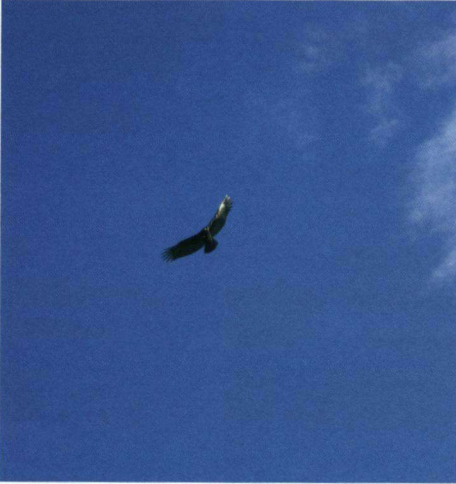
Zwarte Gier in de omgeving van het gebied waar we de zeeschildpadden gingen bekijken.

Ibissen. Ze zijn niet een beetje roze of hier en daar een beetje rood, maar echt vuurrood. We zien Geelstuitbuidelspreeuwen Cacicus cela , een soort Amerikaanse 'wevervogel', in en uit hun nest vliegen en een Amerikaanse Fregatvogel boven de oceaan. Op het uiterste puntje liggen houten vissersbootjes met grote geverfde letters: 'In God we trust'. Een puur stukje Suriname!