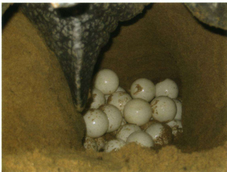
Zeeschildpadden leggen 's nachts hun eieren. Tijdens de legperiode moeten zij goed worden bewaakt.

Eerst naar de Cultuurtuin met onder andere Vorkstaartkoningstiran Tyrannus savana , de Vlindertuin en later ook naar Leonsberg, de aanlegplaats voor de boten naar Braampunt. De tocht naar Braampunt is één van de grootste belevenissen geworden. Als je geluk hebt, zie je brakwaterdolfijnen. Ieder zit dus op scherp. Een brede, stromende Surinamerivier, aan beide zijden oerwoud, af en toe een zilverreiger. Plotseling is er beweging in het water en de eerste dolfijn springt op, natuurlijk slechts door een paar van ons gezien. Maar de schipper heeft zo zijn trucjes: hij kan het geluid van de dolfijnen ook fluiten! Het werkt. We kunnen ze een hele tijd bekijken. Dichter bij Braampunt verschijnen de eerste Rode