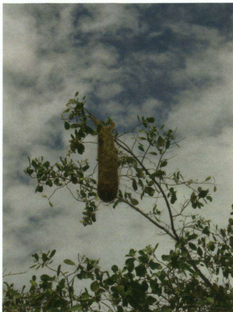
Een hangend nest van een Geelstuitbuidelspreuw.