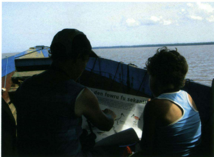
Vogels leren herkennen op een Surinaamse vogelposter met kleindochter.

Crotophaga major en Crotophaga ani Dwergduiven Columbina minuta en de vijandige Geelkopcaracara Milvago chimachima en Roodkopgieren Cathartes aura , Mangroveeigers Butorides striata , Grijsborstpurperzwaluw en nog veel meer. Na het vertrek brengt een bootje ons over de Commewijne en fietsen we naar ons volgende logeeraadres, De Plantage bij Tamanredjo. Een luiaard hangt daar onbeweeglijk in een hoge boom.