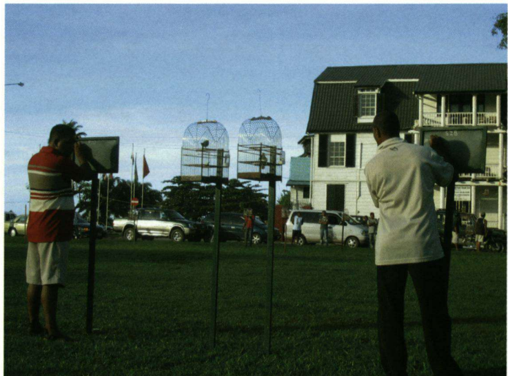
Twee mannen houden op schoolborden de stand bij tijdens de vogelzangwedstrijden.

Enkele dagen later gaan we naar Albina en vandaar naar een logeergebouw van STINASU, waar we zeeschildpadden kunnen zien die hun eieren op het strand komen leggen. Het busje naar Albina is erg vol. Wij zijn met z'n zevenen plus een STINASU-medewerker, de reisleader en de chauffeur. Na de bustocht moeten we nog een heerlijk eind varen met een bootje. We komen 's middags tegen vieren aan. Op het strand vinden we kleine schildpadjes die net uit het ei zijn gekomen en nu proberen het veilige water te bereiken. Zwarte Gieren Coragyps atratus zitten hoog in de boom en speuren het strand af op zoek naar deze kleintjes. De overnachtingsplek heeft als groot voordeel dat we in een gebouw logeren dat aan het strand staat, waar 's nachts de zeeschildpadden hun eieren komen leggen. STINASU heeft medewerkers die gedurende de legperiode – van februari tot augustus – overdag en 's nachts wacht lopen langs het strand. Ze beschermen de nesten tegen het roven van de kostbare eieren door de plaatselijke bevolking en tellen hoeveel schildpadden er komen leggen. 's Avonds worden ze beloond: de bewaker komt ons om half-tien waarschuwen dat er een Aitkanti (betekent acht kanten) of Lederschildpad