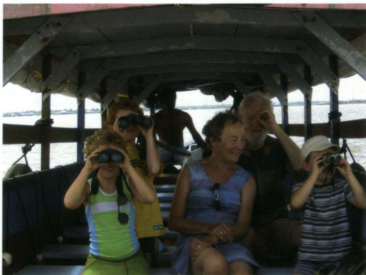
De hele familie zoekt Rode Ibissen.

De afsluitdop blijkt echter vast te zitten. Het lukt me niet dat probleem op te lossen. Ook anderen krijgen het niet voor elkaar. Dan ontpopt onze gids zich als een soort duizendpoot. Hij lost het probleem binnen tien seconden op door gebruik te maken van een revolver die hij uit zijn tas te voorschijn tovert en vervolgens gebruikt als hamer. De Amerikaanse Reuzenijsvogel Megaceryle torquata en de kleinere Groene IJsvogel Chloroceryle americana laten zich regelmatig goed zien. Verschillende toekansoorten en nog meer vogels tonen hun kleurenpracht. De