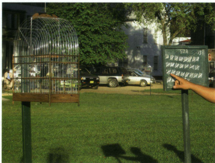
Op zondagochtend worden zangvogelwedstrijden gehouden in Paramaribo.

Paramaribo staat bekend om de zangvogelwedstrijden, die elke zondagochtend op het Onafhankelijkheidsplein worden gehouden. In de stad zijn vaak mannen te zien – het zijn altijd mannen – met een