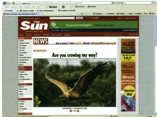
Een behendige Bonte Kraai lift mee op de rug van een Vale Gier.

Het kan zeer handig zijn tijdens een vakantie een iPod of mp3-speler met vogelgeluiden mee te nemen. Daartoe zijn er heel veel goede cd-roms te koop, maar ja door al dat gezang kun je in het veld niet direct helder krijgen welke soort je hoort. Vergelijken met de geluiden die vooraf op een