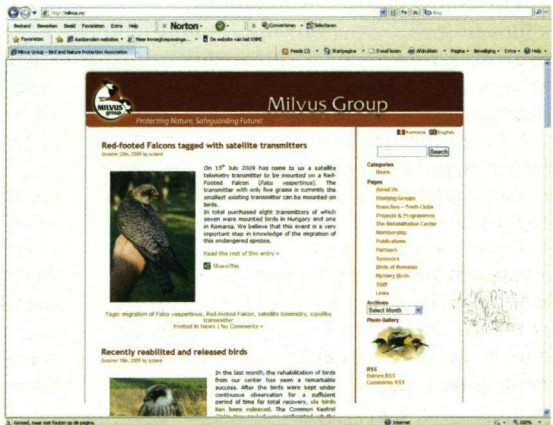
De Milvusgroep van jonge vogelaars zet zich in voor natuurbescherming in Roemenië.

geplaatst die beelden doorgaf van broedende Ooievaars in Dumbravioara.