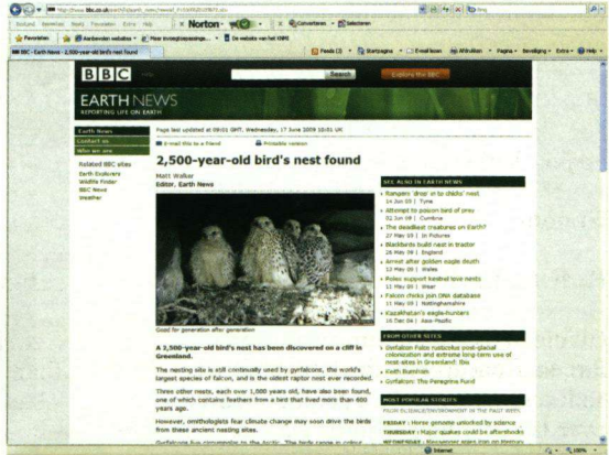
Een website van de BBC geeft informatie over een ouderd giervalkennest op Groenland dat al ruim tweeduizend jaar in gebruik is.

The Association for Bird and Nature Protection de 'Milvus Group' heeft een missie en deze is te vinden op: http://milvus.ro/ . De missie van de groep, die zonder winst oogmerk haar activiteiten uitvoert, wil zich richten op educatie, onderzoek en advies om zo Roemenië voor mens en dier een goede plek te laten zijn. Jonge vogelaars richtten in 1991 de Milvusgroep op. Zij werken samen met de Romanian Ornithological Society. Op de website was in het voorjaar ook een webcam