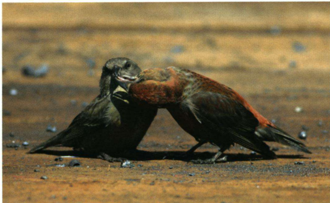
Een vrouwtje Kruisbek voert een volwassen mannetje met metaalslakken bij het gasveld bij Ormen Lange.