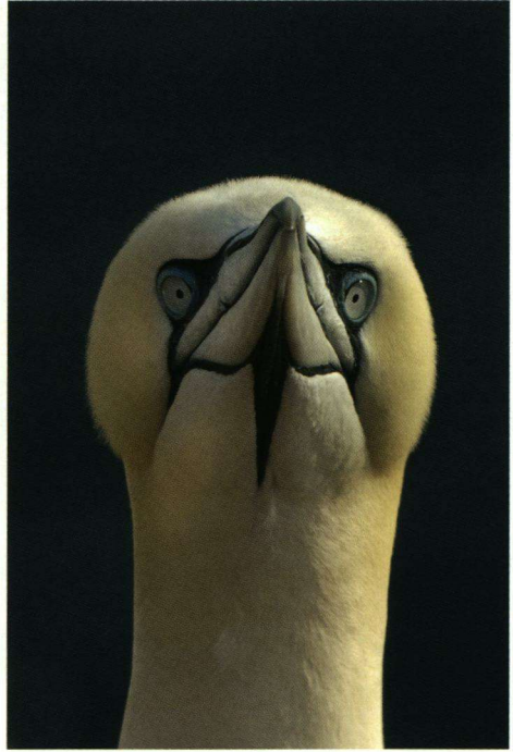
Het kopprofiel eem Jan-van-gent.

Wij waren vooral op het eiland voor de broedvogels. Behalve de ‘jannen’ waren dat: vijftiwintighonderd paar Zeekoeten, zeventuizend paar Drieteenmeeuwen, vijftig paar Noordse Stormvogels en een twintigtal Alken. Ook de gebrilde vorm van de Zeekoet komt hier voor. Op de ‘bovenverdieping’ van het eiland kan men helemaal rondlopen en naar de opvallende rots ‘Lange Anna’ lopen. Vanaf het mooi aangelegde pad heeft men goed zicht op de koloniebroeders. Men moet naar de noordkant lopen, maar het is er allemaal kleinschalig en het is niet moeilijk de juiste weg te vinden. De Jan-van-genten kan men natuurlijk niet missen, maar minder