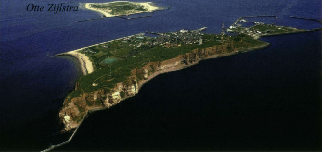
Luchtfoto met Helgoland en Düne.