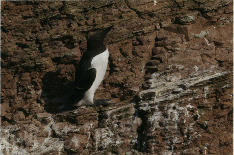
Zeekoet op de rode rotsen.