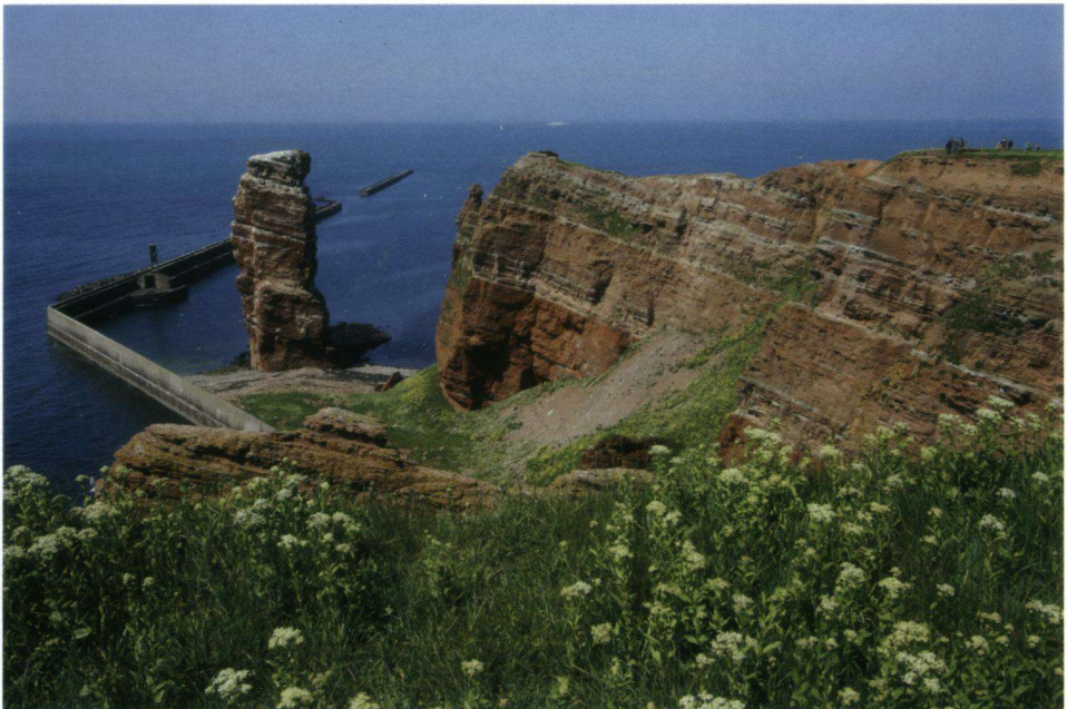
Overzicht op de bekende vogelrotsen en Lange Anna.

geweest. De boten daarheen gaan elk half uur en doen slechts vijf minuten over de overtocht. Vroeger zat Düne vast aan het hoofdeiland, maar sinds de achttiende eeuw – na een zware storm – is het los komen te liggen. Omdat dit eiland