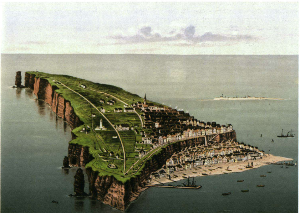
Heligoland in vogelperspectief rond het einde van de negentiende eeuw. De twee niveaus zijn goed te zien.