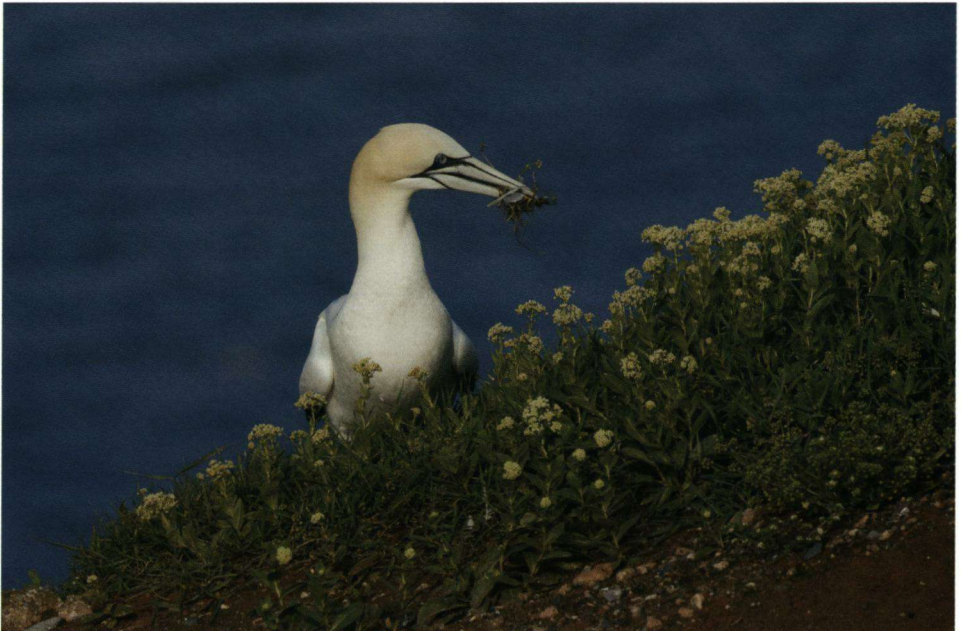
Jan-van-gent zoekt nestmateriaal.

beneden op de plek waar ze dachten een nest te hebben. Als ze zich dan vergist blijken te hebben dan volgt een knokpartij. Als volleerde schermers gaan ze tekeer met hun prachtig aangepaste kopsnavelprofiel. Als het partners betreft dan krijgt men een geheel ander gedrag te zien en soms resulteert dat in een gezamenlijke pose met beide snavels omhoog. De Zeekoeten hebben een geheel andere landingstechniek: ze komen met hun schijnbaar veel te korte vleugels aanvliegen en laten zich vallen op het