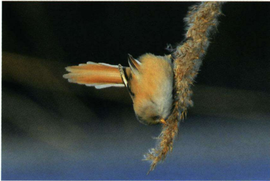
Baardman op 8 januari 2010 in de Rietputten tussen Vlaardingen en Maassluis.