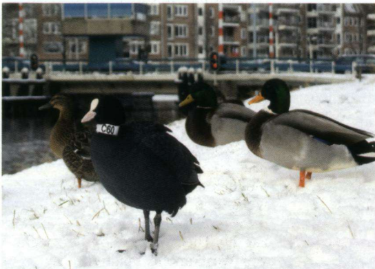
'Meerkoet C60' uit Polen op 29 januari 2010 tussen Wilde Eenden in de stad Groningen.

circuleerden, op een Pools project. Meer hierover is te vinden op de blogs van het Kolring Team: http://kolring.blogspot.com/2010/01/next-polish-coot-in-germany.html . Het betreft hier een Meerkoet die in Bochum (Duitsland) werd waargenomen en op 26 september 2009 was geringd bij het Miedwie meer te Polen. De vogel bevond zich op 560 km van de plek waar deze geringd werd. Een tweede vogel uit het project werd teruggevonden in Bremen op 31 december 2009 en zat daar op 1 januari 2010 nog. Deze vogel bevond zich vervolgens op 28 januari 2010 in Groningen. Toch opmerkelijk dat deze vogels dergelijke afstanden afleggen. Voor de Groningse vogel zie: http://www.avifaunagroningen.nl/index.php?option=com_ifusion&view=wrapper&jname=phpbb3&wrap=viewtopic.php?t=1284 . Op 8 februari 2010 was de vogel nog aanwezig in Groningen.