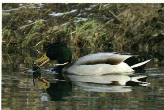
Een Wilde Eend zoekt variatie voor het menu met Eendenkroos op 3 januari 2010 in de Amsterdamsse Waterleidingduinen nabij de Oranjekom.

In het Vogeljaar 43(5):222-223 (1995) staat een artikel met een serie foto's van een vrouwtje Wilde Eend die een kikker eet. Het stukje is geschreven door Auke Terluin. Hij verwijst in de tekst ook naar 'Een jaar in scherven' door Koos van Zomeren, die het gedrag van vleesetende eenden aan Siegfried Woldhek meldde. In het Vogeljaar 54(4):166 (2006) staat een foto genomen door Nol Ploegmakers. Daarop is een eend te zien met een pad in de snavel. In januari 2010 kwamen Rob Buiters en Ricardo van Dijk met waarnemingen van