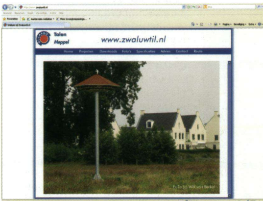
Deze moderne duiventillen staan op verscheidene plaatsen verspreid over Nederland.

raakte. Meeuwen zijn moeilijk te determineren soorten en vooral de verschillende kleden en variatie maken het lastig. Pontische Meeuwen zijn geweldig fascinerend en ook erg mooi. Ies is betrokken bij de Gull-Research Organisatie en met de leden hiervan wordt er ook veel naar ringen gekeken. Ze worden uitgebreid gedocumenteerd met foto's en aantekeningen over de rui. Ies hoopt nog eens een Reuzenzwartkopmeeuw of een klassieke Amerikaanse Zilvermeeuw te vinden. Een leuke beloning van al het onderzoek, zijn website en de vele foto's was de vermelding in de tweede vernieuwde editie van de 'Collins Birdguide' door Killian Mullarney! In het najaar houden de meeuwen hem bezig en in het voorjaar is hij te vinden op de trektelpost van Breskens. Er valt in Zeeland en zeker nabij Westkapelle veel te beleven. De website is opgezet als hobby. Bij de huidige website zijn de nieuwste technieken toegepast. Ies doet het allemaal zelf en hij kan dus de website naar eigen goeddunken inrichten.