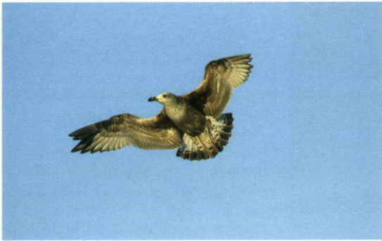
Geelpootmeeuw in de haven van Étapes-sur-Mer, Frankrijk, op 25 oktober 2008.