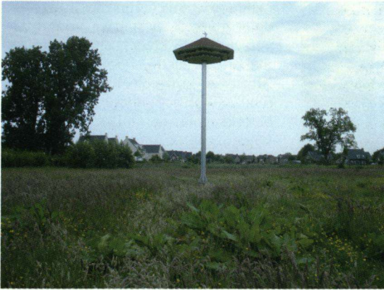
Een huiszwaluwtil in Aarle-Rixtel (N.-Br.).