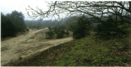
Het Havelterzand in Drenthe.