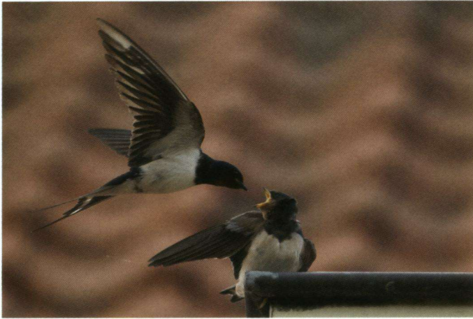
Deze boerenzwaluw voert water aan het jong tijdens een langdurig droge voorjaarsperiode (2009). De keelzak hangt wat uit (gewicht!) en er hangt een waterdruppel aan de snavel van de oudervogel.

een prachtige boerenzwaluwposter gemaakt. De poster is gratis aan te vragen via http://www.jaarvandeboerenzwaluw.nl .