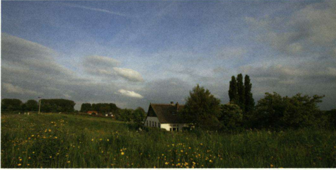
Afwisselende landschappen met kruidenrijke bermen en gevarieerde begroeiing bieden een insectenrijk, goed foerageergebied, ook tijdens slechtweertperiodes. Lekdijk te Culemborg (2009).

Ook na het Jaar van de Boerenzwaluw blijft deze telmogelijkheid bestaan. Deze telling kan heel goed gecombineerd worden met weidevogelbeschermingswerk of nestkastcontroles van bijvoorbeeld Steenuil of Kerkuil.