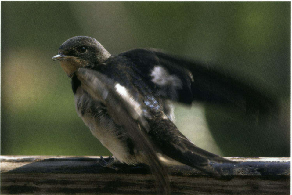
Het Jaar van de Boerenzwaluw is niet alleen gericht op vogelaars. Ook weidevogelwerkgroepen, agrarische natuurverenigingen en bijvoorbeeld paardenhoudende buitenlui kunnen een bijdrage leveren. Zij kunnen onder andere helpen meer kennis te verzamelen over de sleutelfactoren voor herstel.

Het Jaar van de Boerenzwaluw is niet alleen gericht op vogelaars. Deze actieve tellers vormen natuurlijk wel een belangrijke basis. Daarnaast richten we ons onder andere op weidevogelwerkgroepen, agrarische natuurverenigingen en paardenhoudende buitenlui. Het Jaar van de Boerenzwaluw moet bijvoorbeeld meer kennis opleveren van de sleutelfactoren voor herstel. Ook willen we het draagvlak voor de Boerenzwaluw onder de bewoners van het landelijk gebied vergroten. Dat moet leiden tot meer geschikte broedlocaties en goed leefgebied. Ten slotte willen we samenhangende verbeteringen langs de trekroute en in de overwinterings-