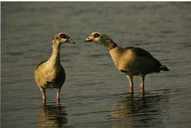
Noord-Holland handhaaft verbod op bestrijding van Nijlganzen 'met geweer en hond'.

Verspreid over de Veluwe, het IJsseldal en Drenthe staan de komende jaren acht voorheen pikdonkere stukken natuur in het licht. Doel van dit onderzoek 'LichtOpNatuur' is de kleur te vinden die de natuur het