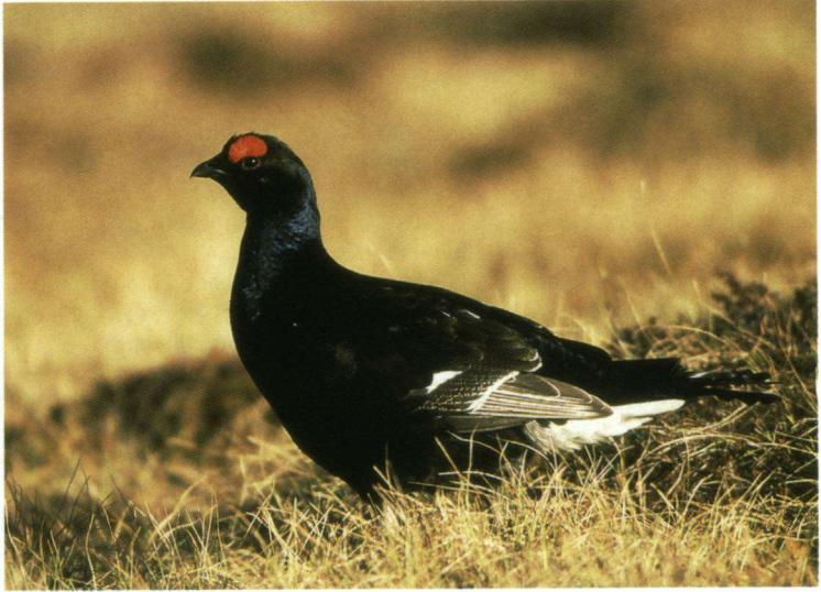
Vaarwel Korhoenders.

minste schaad. Uit eerdere onderzoeken is gebleken dat rood licht vogels op de trek ernstig verstoort en dat nachtdieren juist beter af zijn met datzelfde rode licht. De uitkomsten van het onderzoek zijn vooral van belang voor de verlichting van fietspaden in het buitengebied.