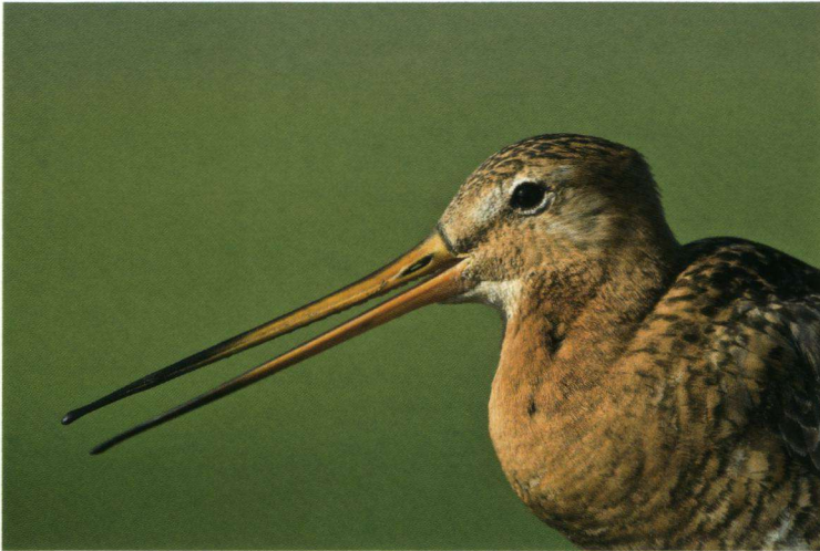
Grutto's trekken naar West-Friesland.

en 2006 met 52 procent afgenomen. Toch vindt de Raad van State dat het niet zo slecht gaat dat er geen eieren meer mogen worden geraapt. Als het provinciebestuur volgend jaar een nieuwe ontheffing voorstelt, kan dit voor de Faunabescherming een aanknopingspunt zijn voor nieuwe procedures.