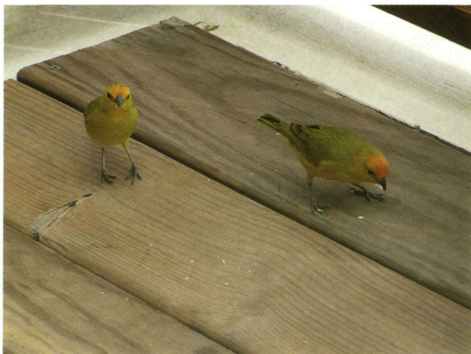
Saffraangorzen bij het resort.

als een hondje. Ook waren er nog drie Oranje Troepialen, twee Roodkraaggorzen, twee Tropische Spotlijsters en drie Verreaux' Duiven. Laatstgenoemde vind ik eigenlijk de mooiste van de circa zes duivesoorten op Curaçao. Bij het ontbijt wederom de Blauwstaartsmaragdkolibrie foerageren. Dit keer hebben we die heel mooi en van dichtbij kunnen aanschouwen.