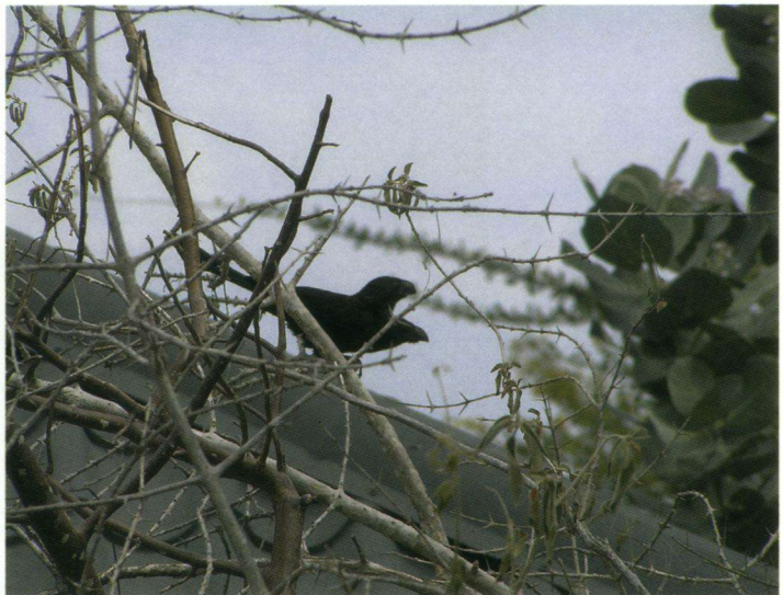
Groefsnavelani bij het resort.

Op 23 februari 8:00 uur op ons balkon wel tien Naaktoogduiven, twee Saffraangorzen, een Gele Troepiaal en een Tropische Spotlijster. Tegenover onze tijdelijke behuizing twee Groefsnavelani's.