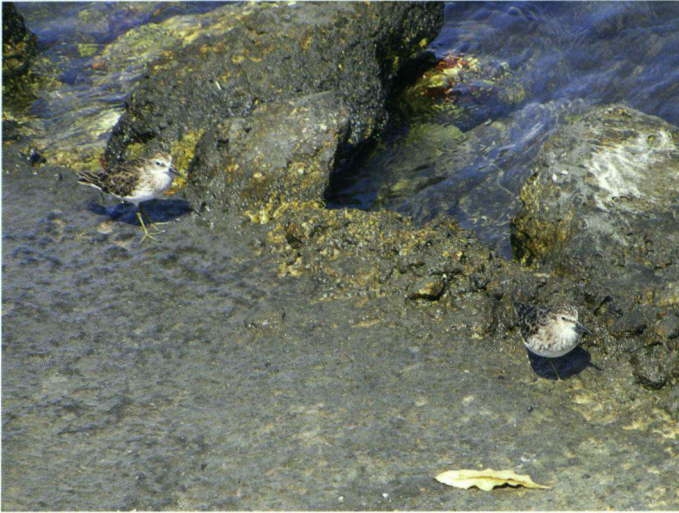
Bij het Waagat werden onder andere enkele Kleinste Strandlopers waargenomen.

kolibrie en minimaal twee Tropische Spotlijsters gesignaleerd. Ik heb sterk de indruk dat het meestal dezelfde spotlijster was die ons balkon aanded om het door ons aangeboden brood te verorberen. Hij schijnt dezelfde mensen na enige tijd te herkennen en is dan minder schuw. Ik verwijs in dit verband naar ons onvolprezen het Vogeljaar 57(5):222.