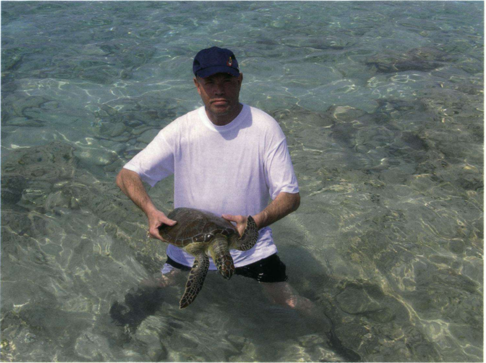
Op het eiland zijn ook zeeschildpadden te zien.