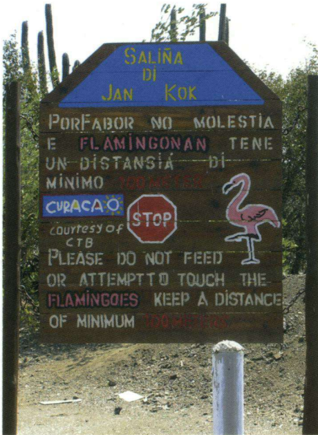
In de zoutpannem in de Jan Kokbaai worden flamingo's beschermd.

Op een aangrenzend parkeerterrein zaten vier Caribische Troepialen Quiscalus lugubris . Vanaf een terras aan de Handelskade hadden we niet alleen zicht op de al eerder genoemde Pontjesbrug, eigenlijk Koningin Emmabrug, maar ook op vijf Amerikaanse Fregatvogels alsmede op twee Koningssterns.