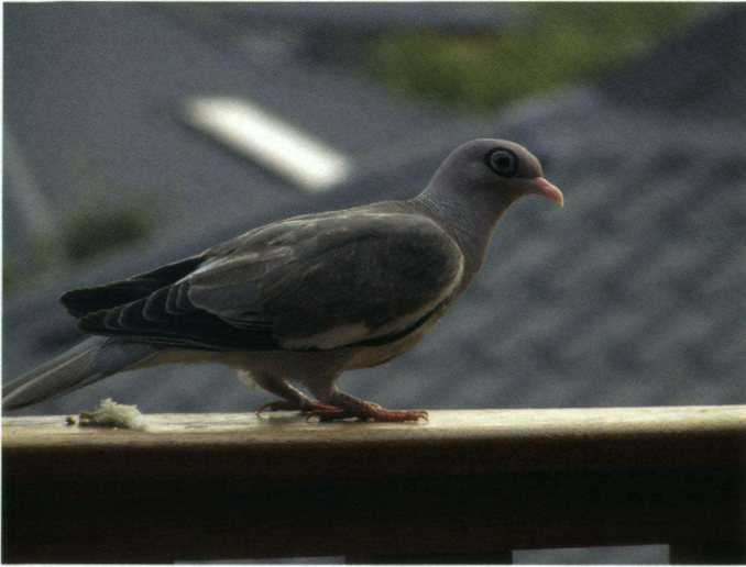
Een Naaktoogduif bij het Morena Resort.

dactylus johnstonei . Dit ging natuurlijk de hele week door. De volgende morgen om 7:00 uur – het was net licht – waren er vanaf het balkon al diverse soorten te bewonderen. Ik zag vier Oranje Troepialen, een Tropische Spotlijster Mimus gilvus , zes Maïsparkieten Aratinga pertinax en een Roodkraaggor Zonotrichia capensis (ook wel Andesvink genoemd). Verder twee Naaktoogduiven Patagioenas corensis , een Verreaux'Duif Leptotila verreauxi , twee Musduiven Columbina passerina of beter gezegd duifjes want ze zijn echt klein: tussen de 15 en 18 cm. De duiven hoorde je niet maar de Maïsparkieten schetterden heel wat af. Tijdens het ontbijt even na