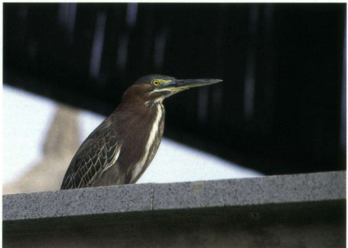
Groene Reiger bij de beach club.

achten bij de receptie zagen we een Gele Troepiaal Icterus nigrogularis , vier Suikerdiefjes Coereba flaveola , een Blauwstaart-smaragdkolibrie Chlorostilbon mellisugus en nog drie Tropische Spotlijsters. Om 9:00 uur begaven we ons naar de Beach Club Zanzibar. Tot onze blijde verrassing zat daar bij de ingang op de muur van een hoog gemetseld vijvertje een Groene Reiger Butorides virescens . Bij vervolfbezoeken aan het strand is deze soort niet weer gezien, hoogstwaarschijnlijk omdat het dan telkens later en dus drukker was. Verder ook hier een Tropische Spotlijster, net buiten het terrein vier Maïsparkieten, in de overhuifde bar vier Suikerdiefjes, drie Mus-