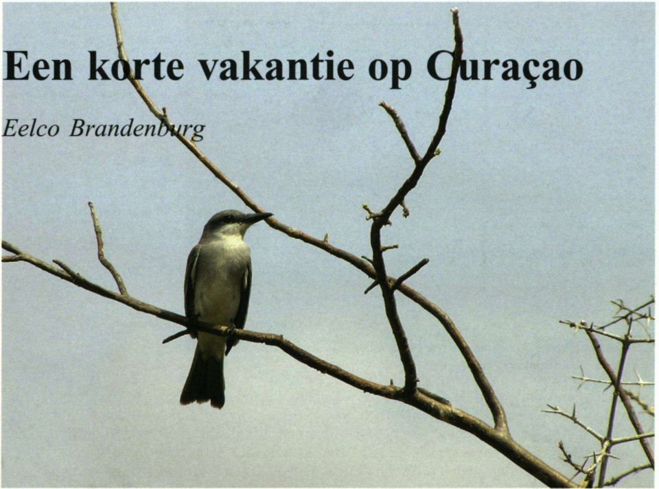
De Tropische Spotlijster werd al op de dag na aankomst gezien.