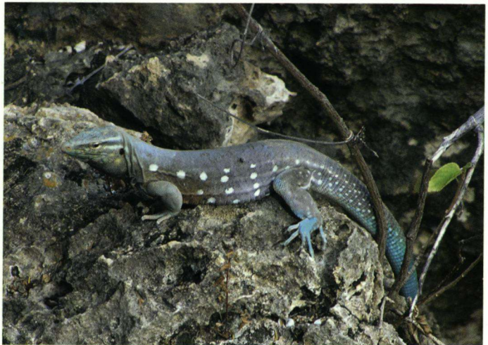
Blauwe Renhagedis in de omgeving van het resort.

Op zaterdag 20 februari bij het krieken van de dag waren vanaf ons balkon vier Gele Troepialen te zien. Deze soort blaft