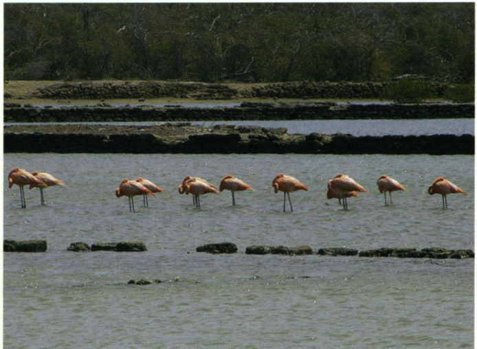
Bij de Jan Kokbaai werden onder andere 42 Caribische Flamingo's geteld.

In de middag begaven we ons naar Willemstad. Even buiten de wijk Otrabanda niet ver van het honkbalstadion en de Megapier, waar de grote cruiseschepen aanmeren, liggen enkele behoorlijk stinkende poelen. Hier zagen wij: twee Witbuikreigers Egretta tricolor en twee Geelkruinkwakken Nyctanassa violacea waaronder een onvolwassen vogel.