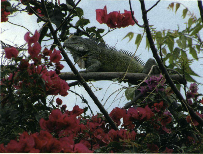
Groene Leguaan.

duifjes schuifelend in het zand tussen de strandbedden en een rustig overvliegende Bruine Pelikaan Pelecanus occidentalis . Terugwandelen naar het resort namen we tegenover het strand tussen de prachtige bloemen twee Groefsnavelani's Crotophaga sulcirostris waar. Deze vielen aanvankelijk door de weelderige bloei van de planten niet op. Iets verder ontdekten we twee Groene Leguanen Iguana iguana . Terug op het resort nog minstens drie Blauwe Renhagedissen Cnemidophorus murinus , één Tropische Spotlijster, twee Groefsnavelani's, misschien dezelfde als hierboven vermeld. Aan het begin van de middag, toen we op de bus naar Willemstad stonden te wacht-