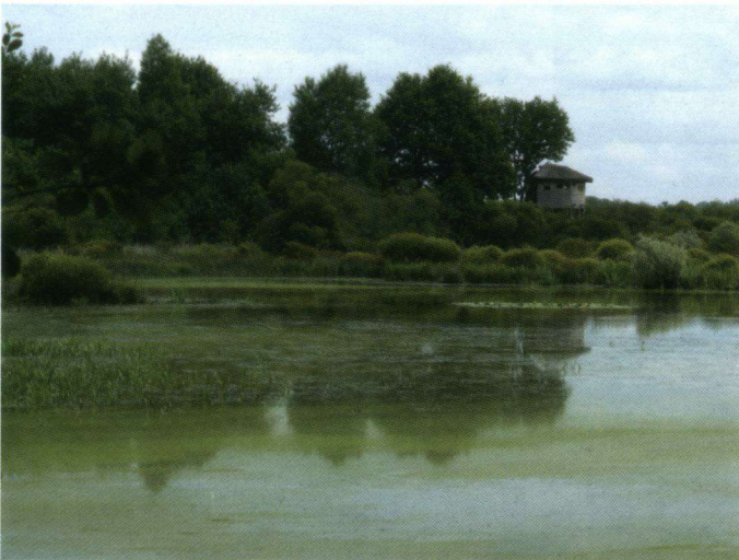
Inham aan de westoever van het Etang des Landes, met zicht op observatiehut 'Le Grand Affût'.

weer een wintertelling. Het telweekend is half januari maar ook waarnemingen van Ooievaars later in de maand worden nog bekeken. Dat kan gaan over verplaatsingen, maar ook over voedselvoorziening, ringnummers, etc. Behalve de telling wordt er ook nog een fotowedstrijd georganiseerd. Kijk voor meer informatie over de telling en de fotowedstrijd op de website van STORK: http://www.ooievaars.eu .