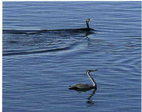
Dezelfde Blauwe Reiger zwemmend met een Aalscholver.