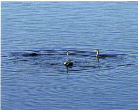
Blauwe Reiger zwemmend in het midden van de Nijl met twee Aalscholvers. Eén van de Aalscholvers duikt net onder water.

■ A. Dijkse, Rommelpot 7, 1797 RN Den Hoorn, Texel, e-mail: Ruigehoek@cs.com.