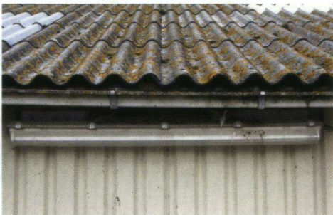
De ruimte tussen de TL-lamp en de dakgoot is voldoende om een nest te kunnen bouwen. Echter er is geen hechting aan de metalen profielplaat aan de bovenkant, dus rusten de nesten op de lampenkap.

De originele boerderijen in de Noordoostpolder zijn schokbetonschuren. Deze typisch gebouwde boerderijen van betonnen elementen bieden voor Huiszwaluwen een goede plek om hun nest aan vast te plakken. De stroefheid van de betonnen elementen is groot waardoor nesten er redelijk goed aan blijven