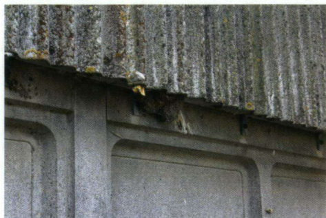
Bij het bouwen van een nieuw nest wordt regelmatig gebruikgemaakt van de bevestigingsbeugels.