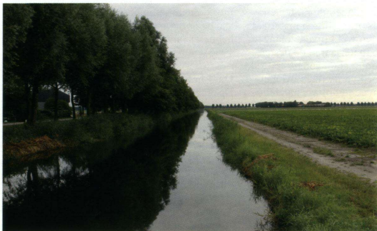
Noordermeertoct met boomsingel die veel luwte biedt. Voor zwaluwen is dit een ideaal jachtgebied.

Vrijwilligers die in het voorjaar actief weidevogels beschermen, hebben veel contact met boeren in het buitengebied. Ze komen op het erf en zien daar over het algemeen ook wel Huis- of Boerenzwaluwen vliegen. Echter tot het tellen kwam het in het verleden niet. In 2005 zijn weidevogelvrijwilligers begonnen om de huis- en boerenzwaluwpopulatie in kaart te brengen. Uit nieuwsgierigheid, maar ook om onder andere een beter contact te verkrijgen tussen boeren en vrijwilligers, is men met dit initiatief begonnen. Eén van de zeven weidevogelbeschermingsgroepen in Flevoland, de 'Vogelwacht Rutten en omstreken,' heeft deze telling erg gestructureerd opgepakt en de getallen van hun telling zijn het meest representatief om vijf jaar tellen in beeld te brengen.