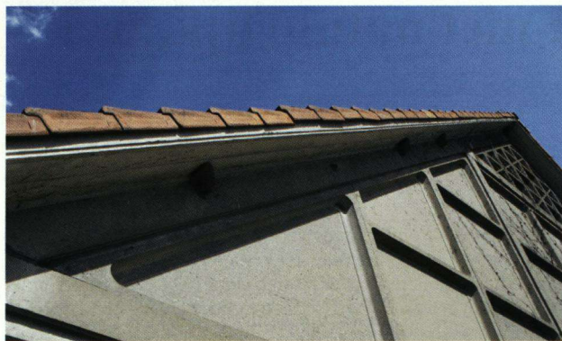
De kopgevel van een schokbetonschuur met veel huiszwaluwnesten. Ook zichtbaar zijn de bevestigingsbouten waarop ze de nesten metselen.