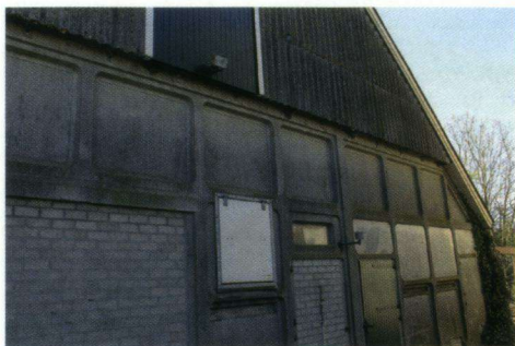
Achtergevels met overstekende golfplaten bieden beschutte plekken voor huiszwaluwnesten.

stilstaan doen ze niet echt. Nu ineens iemand jaarlijks deze vrolijke fladderaars telt, maakt dit hun besef dat zwaluwen thuishoren op hun bedrijf een stuk groter. Ze weten wel feilloos