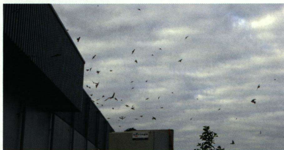
Wanneer de jongen in de nesten gevoed moeten worden is het een drukte van belang in de lucht.

andere wegen (Tabel 1). Bij de Boerenzwaluw is dit niet het geval. De Noordermeerweg ligt parallel aan de IJsselmeerdijk. Op bepaalde dagen kunnen er enorme wolken vliegen (onder andere Groene Gaasvliegen) boven de IJsselmeerdijk hangen, maar ook boven de bomensingel die langs de Noordermeerweg is gelegen. Deze 'boost' aan vliegen levert veel voedsel op voor de beide soorten zwaluwen. Waarom er nu juist zoveel meer Huiszwaluwen zitten ten opzichte van de Boerenzwaluw is niet logisch te verklaren. Wellicht dat de ligging op 800 m van het IJsselmeer voor Huiszwaluwen van groter belang is bij het zoeken van voedsel en dat Boerenzwaluwen dus minder ver weg vliegen voor hun voedsel. Ook de tocht tegenover de Noordermeerweg biedt wellicht net iets meer voedsel voor de Huiszwaluw dan elders aan de buitenweg van Rutten. Het water uit deze tocht komt 's zomers rechtstreeks uit het IJsselmeer. Grappig aan de telling is wel dat aan de buitenwegen Huis- en Boerenzwaluw voorkomen. In de dorpskernen van Rutten, Creil of Espel zijn van beide twee soorten geen sporen te vinden.