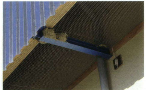
Doorgaans wordt het verschil tussen huis- en boerenzwaluw nesten uitgelegd door te zeggen dat die van Huiszwaluwen hangen aan muur of dakoverstek en de nesten van Boerenzwaluwen steunen op een balk of iets dergelijks eronder. Tellers in de Noordoostpolder vinden het echter heel normaal nesten van Huiszwaluwen aan te treffen die met de bodem ook op een balk steunen.

Wat bij de telling van de Huiszwaluwen eruit springt, zijn de grote aantallen Huiszwaluwen aan de Noordermeerweg ten opzichte van de