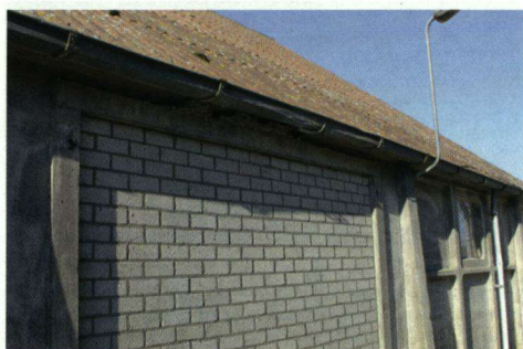
Ieder randje rondom de schokbetonschuur wordt benut als nestplek.

Aan een achttal wegen rondom Rutten, te weten de Lemsterweg, Veneweg, Hopweg, Ruttenseweg, Noordermeerweg, IJzerpad, Gemaalweg en het Ruttensepad, vinden de zwaluwteellingen plaats (Figuur 1). De boerderijen en huizen aan de wegen zijn zeer gestructureerd ingedeeld en goed vergelijkbaar. Op iedere kavel (variërend van 18-30