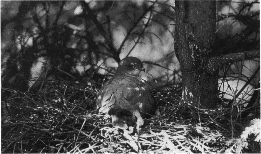
Volwassen spervervrouwtje broedend, Havelterberg, juni 1994 (Herman F. Gruppen)

In het noordelijke deel van de Oldematen zijn 3 buizerdnesten uitgehaald. Bij alle bekende horsten was geklommen. Het aanwezige paar Haviken had geen nest, evenmin de normaal aanwezige Zwarte Kraaien. De daders zijn onbekend. Volgend jaar zal dit object extra aandacht krijgen (med. J. Bredenbeek).