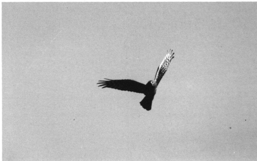
Foto. Adult vrouwtje Blauwe Kiekendief, Diemerzeedijk, 13 oktober 1996 (Nirk Zijlmans). Adult female Hen Harrier.

Adres: Mastenbroek 129, 8431 MX Oosterwolde.