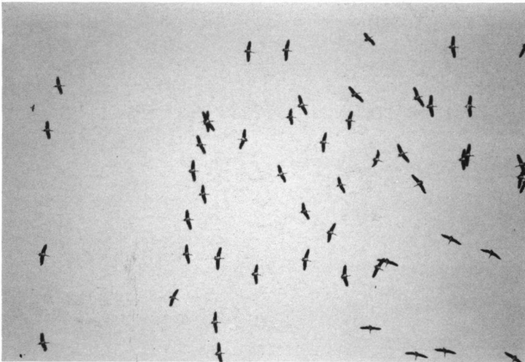
Bosporus, Turkije 1997, Zwarte ooievaars.

De Bosporus is de verbinding tussen Azië en Europa en ook de scheiding van de Zwarte zee met uiteindelijk de Middellandse zee. En het is de vliegroute van trekvogels die naar het zuiden moeten en niet over water willen vliegen. Voor de zwevers omdat er geen thermiek is en voor de peddelaars omdat ze niet kunnen uitrusten als ze geen eend zijn. Vooral is de Bosporus bekend om de populatie Schreeuwarenden die leven in het immense gebied Oost-Europa. Bastaardarenden komen er maar mondjesmaat langs omdat hun verspreidingsgebied meer oostelijk ligt en dus oostelijk van de Zwarte zee via centraal Turkije naar het zuiden gaan. Niet alleen roefvogels komen in groten getale langs.