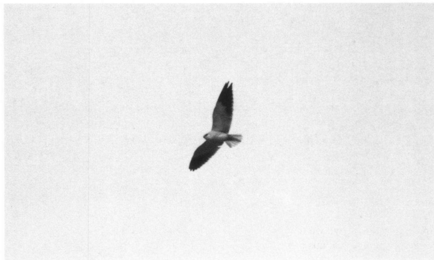
Foto 2. Grijze Wouw, Texel, 30 maart 1998. Black-shouldered Kite, Texel, 30 March 1998. (Martijn de Jonge).

Adres: Simonshavenstraat 38, 1107 VB Amsterdam.