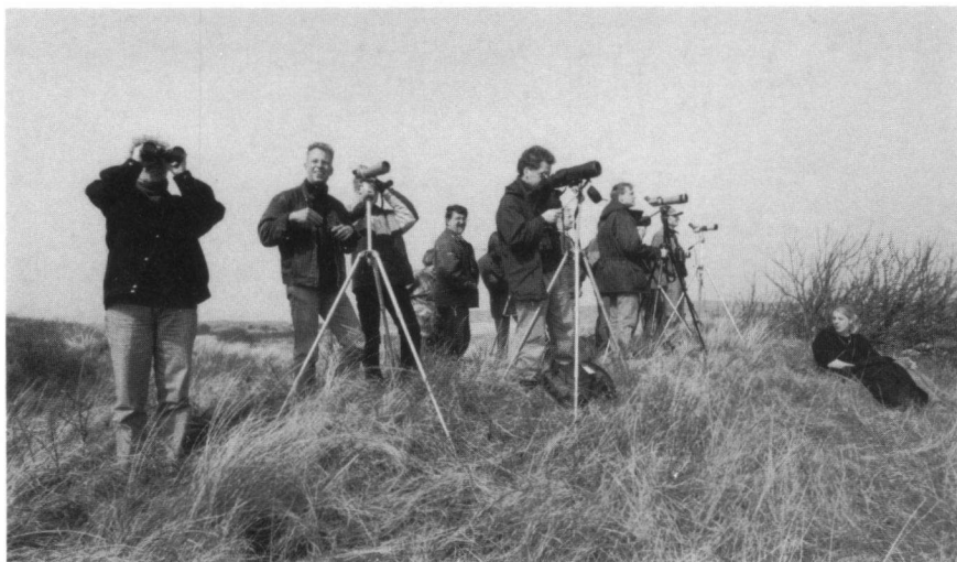
Foto 1. Vogelaars bekijken de Grijze Wouw op Texel, 30 maart 1998. Watching the Black-shouldered Kite, Texel, 30 March 1998. (Martijn de Jonge).