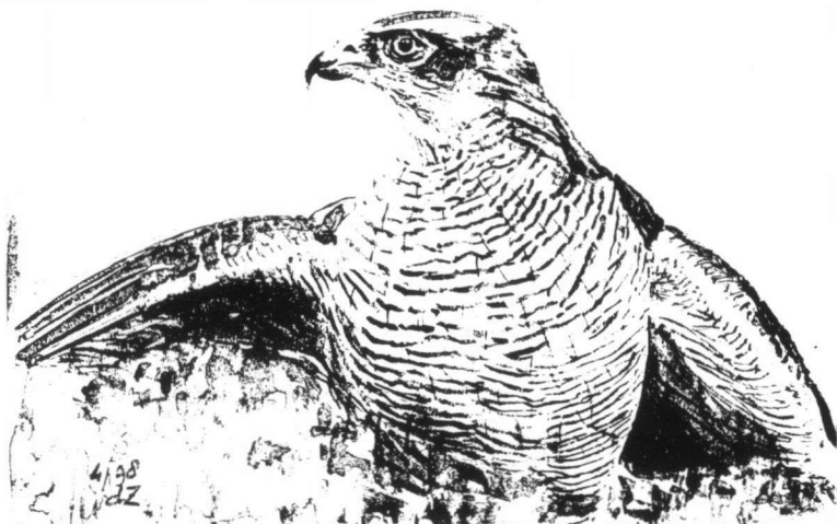
Mantelende volwassen Havik (tekening: Ronald de Zeeuw).