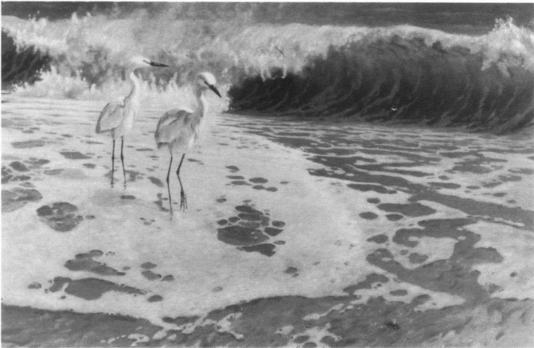
Plaat 2. Freak wave - Kleine Zilverreigers (olieverf).