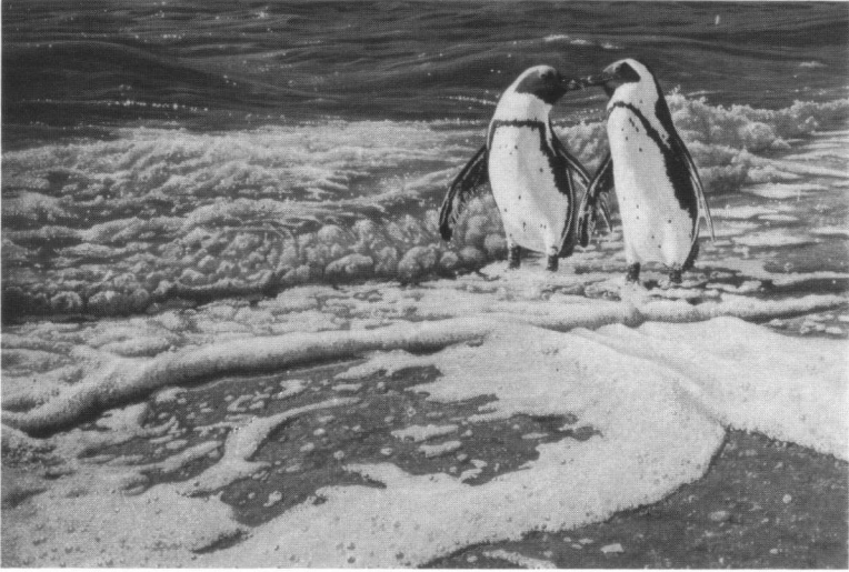
Plaat 1. Lover's beach met zwartvoetpinguïns (gouache).