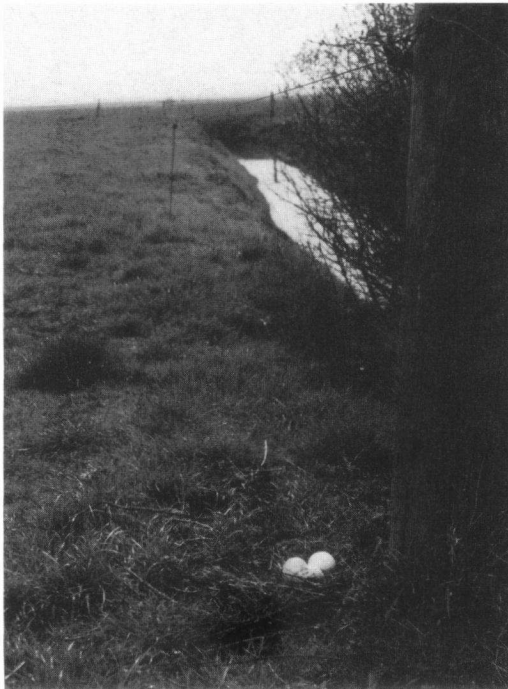
Foto. Buizerdnest op onkarakteristieke plaats in karakteristiek Fries landschap, 17 april 2000 (Yde van der Heide). Atypical nest of Common Buzzard in typical Frisian landscape, 17 April 2000.

Het betreffende landschap is een open weidegebied op zeeklei. Afgezien van erfbeplanting is het aantal mogelijkheden om in een bosje of houtwal te broeden zeer klein (maar niet nihil). In dat opzicht vertoont ons grondnest veel gelijkenis met het geval dat Jan van der Sluis vorig jaar vaststelde ter hoogte van Hommerts (De Takkeling 7: 209-211).