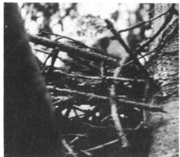
Foto. Het witte buizerdvrouwkje loert tussen de takken van het nest door. The white female Buzzard on the nest.