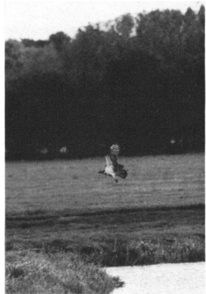
Foto's. Poging tot visvangst van een jonge Visarend in de Duivenvoordse Polder, herfst 1999. Attempt to catch a fish by juvenile Osprey, Duivenvoordse Polder, Autumn 1999.