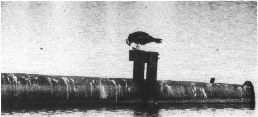
Foto. De geringde Visarend bezig met het verorberen van een vis, vogelplas Starrevaart Leidschendam, herfst 1999. The ringed Osprey consuming a fish, Starrevaart, Leidschendam, Autumn 1999.