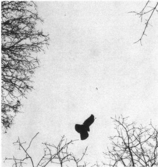
De gestrikte Buizerd in de boomtoppen, Boswachterij Appelscha, 31 maart 2001 (Janco Mulder). The entangled Common Buzzard, Forestry of Appelscha, 31 March 2001.

Tot onze verbazing zagen we een Buizerd die wel op zeer rare manier boven een zandpad hing, op een hoogte van zo'n 20 meter. Bij benadering bleek de vogel te zijn verweekeld in vliegertouw dat over enkele tientallen meters vast zat in diverse boomtoppen. Aan het uiteinde wapperde een mooi getekende vlieger. De Buizerd is waarschijnlijk laag vliegend, onder de boomkronen door, met een vleugel in aanraking gekomen met het slaphangende touw, waarbij deze een wenteling heeft gemaakt en zichzelf strikte. Het rare hierbij was dat de vogel slechts aan één handpen vasthing (zie Foto's). Door het wild heen en weer vliegen heeft hij zich vastgedraaid en kwam het touw op spanning te staan. Bij ontdekking deed hij nog een paar langzame slagen met de vleugel om weg te komen.