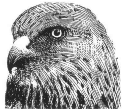
Tekening: Gilbert van Avermaet

Adres: Meester Lokstraat 22, 8427 RD Ravenswoud.