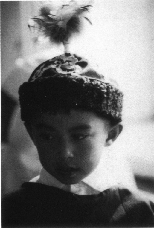
Links: Jongetje met ceremoniële hoed met toefje oehoeveren tijdens een besnijdenisritueel in Oost-Kazakhstan (Chris van Orden). Left: Little boy with cap adorned with feathers of eagle owls during a circumcision ritual in eastern Kazakhstan.

orthodoxen in wierook, heilig water en het kussen van iconen geloven. Het is symboliek die je niet met een logisch verstand moet beoordelen. Mensen die geloven, gaan er van uit dat ze geholpen worden."