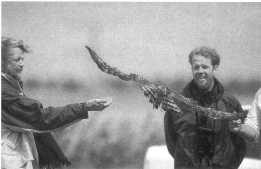
Foto 2. Adult vrouwtje Grauwe Kiekendief wordt, na te zijn gezenderd, losgelaten bij Blijham in Groningen, juli 2003. Radio-tagged female Montagu's Harrier being released near nesting site in Groningen, July 2003.