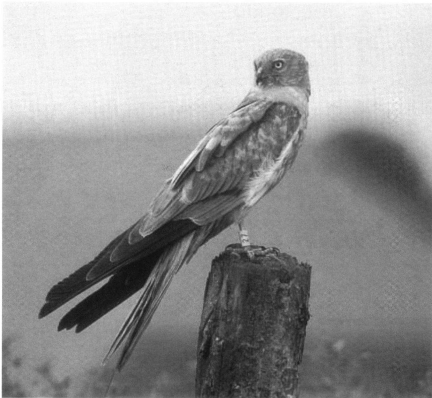
Foto 1. Mannetje geel 27 op paal van beschermingshek rond nest, Noordbroek, juni 2003. Deze vogel werd in 1998 als nestjong bij Klein Ulsda (11 km afstand) geringd, en kreeg een zender aangemeten in 2003. Adult male Yellow 27 with radio-tag near nest in Goningen; this male had been ringed as nestling in 1998, some 11 km away.

Het mannetje geel 27 is het eerste exemplaar waarvan is aangetoond dat hij is geboren in luzerne en daadwerkelijk in luzerne als broedvogel terugkeerde (Foto 1).