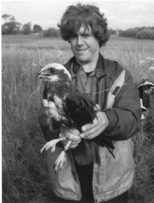
Het adulte vrouwtje op de dag van haar vangst nabij Kristianstad in Zuid-Zweden, in de zomer van 2005. The adult female Marsh Harrier on the day of her capture, near Kristianstad in southern Sweden in summer 2005.

en daarbij de (locale) tijden gezet (Figuur 1). Deze posities zijn geen GPS-locaties en kunnen nogal afwijken van de ware locaties. De meeste posities nabij de Hoeksche Waard zijn echter gelukkig 'high quality locations', waarbij de afwijkingen maximaal een paar honderd meter kunnen zijn. Om 09.00 uur vliegt de vogel ten zuidwesten van Dordrecht en om 10.10 uur nabij Dinterloord, ten zuiden van het Hollandsch Diep. De trektelpost ligt daar qua plaats en tijd dus mooi tussenin. Deze vrouw laat zich dit jaar opvallend goed zien aan de tellers. Zo is ze ook door onze teller Nils Kjellén opgepikt op Falsterbo (11 september). Raymond besluit zijn mailtje met 'Het is Female 3 in de binnenkort te verschijnen Ardea' en 'Ze overwintert precies op het drielandpunt tussen Senegal, Mali en Mauretanië'. Op 30 september voegde Raymond daar nog aan toe dat de vogel de Pyreneeën was overgestoken, vervolgens een oostelijker koers aanhield en vanaf Oost-Spanje de Middellandse Zee is overgestoken. Op dit moment vliegt de vogel door de Sahara in Algerije, vermoedelijk op weg naar haar vaste overwinteringsplek op het drielandpunt in West-Afrika.