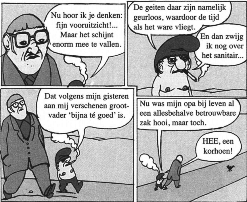
Onderdeel van 'De Wandeling' uit: Daar gaat fout varken, van Gumbah (2006, De Harmonie, Amsterdam).

EJ, Orchidee 8, 7443 LG Nijverdal, eef_jansen@hetnet.nl