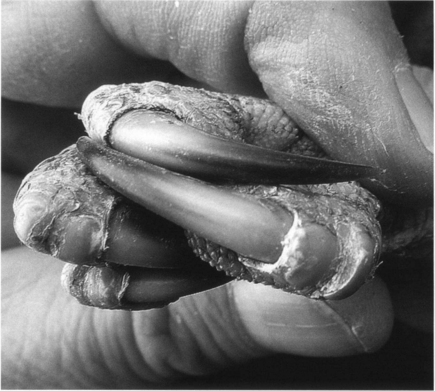
Foto 3. Naar zwart verkleurende nagels van een jonge Buizerd die als pul wit dons had en witte nagels. White-downed Buzzard chicks have white claws which change colour (to black) in the course of time.