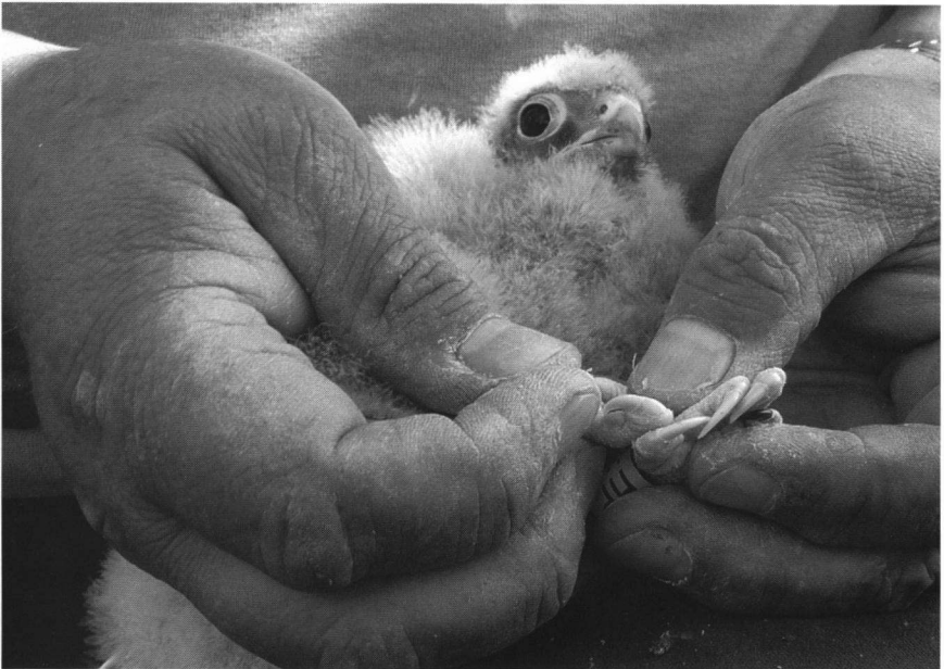
Foto 2. Nestjong vrouwtje Torenvalk met witte nagels, Zwolle, 4 juni 2011. Female nestling Kestrel with white claws, 4 June 2011.