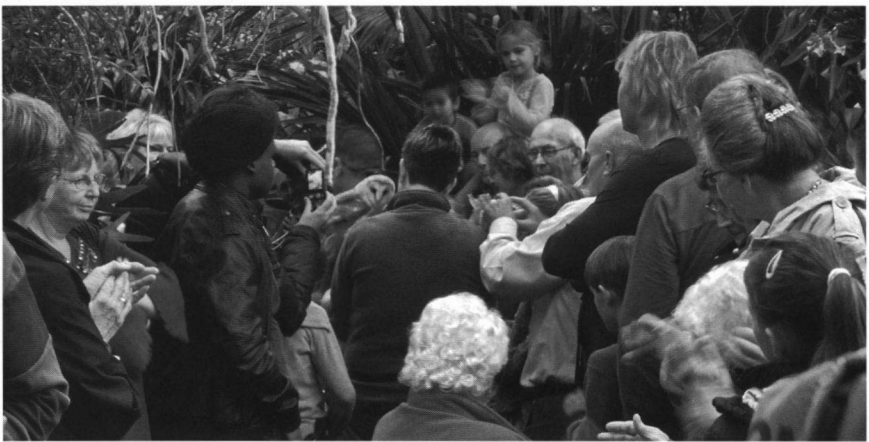
Zoek de uil. Na afloop kunt u ermee op de foto, voor €5.- wel te verstaan.

Van medewerkers van Staatbosbeheer (SBB) ontvingen we diverse reacties. Sommige SBB-ers zijn, voorzichtig gezegd, niet gelukkig met mijn mening over SBB zoals ik die eerder ventileerde. Vaak bleek dat medewerkers de shows vooral zien als een goed middel om het publiek voor te lichten over de natuur (hierover zo meer). De informatie over de negatieve effecten van de shows blijkt onvoldoende bekend. We realiseren ons dat de gedachtenwisseling tussen actievoerders en SBB enkel op hoog niveau heeft plaatsgevonden. Inmiddels hebben wij ook de regiokantoren voorzien van de nodige informatie en vanzelfsprekend hopen we dat we SBB zich binnenkort achter onze actie wil scharen.