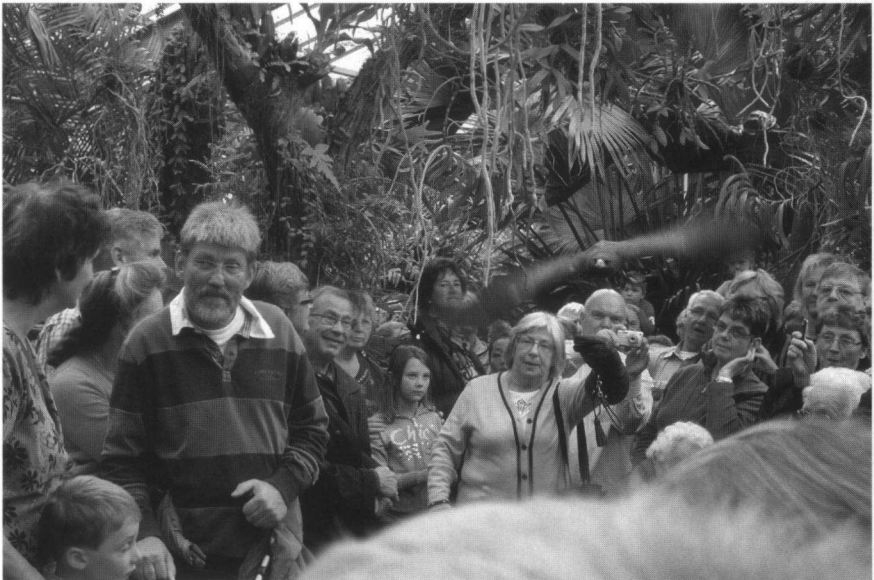
De roofvogel in zijn natuurlijke omgeving, althans volgens de deskundige mening van de roofvogelhouders.

De gedachte dat shows goede voorlichting bieden, blijkt niet alleen bij SBB, maar in het algemeen, een hardnekkige misvatting te zijn. Het onderzoek door Bureau Ulucus (zie rapport op onze website) concludeerde dat op geen van de door hen onderzochte shows sprake was van echte educatie over roofvogels in Nederland. Feitelijk is de situatie nog veel erger. Toeschouwers bij een show krijgen niets te zien van wat past bij roofvogels in de natuur. Vrije roofvogels en uilen gedragen zich geheel anders dan vogels die in een show een kunstje moeten vertonen. Kijk alleen maar naar de afstanden waarop een roofvogel in het wild wegvliegt wanneer hij wordt benaderd door een mens. Shows geven geen ecologisch verantwoord beeld. Behalve dat, wordt er tijdens shows überhaupt weinig informatie gegeven, en wat wordt verteld is grotendeels onzin in de trant van: roofvogels en uilen zitten in de natuur veel stil (wat overigens baarlijke onzin is), daarom is het niet zo erg voor ze om gevangen te zitten, bermen langs snelwegen zijn muizenrijk door de klokhuizen die wij uit de auto's gooien, uilen met donkere ogen zijn nachtjagers, uilen met gele ogen zijn dagjagers (zie ook onze site alwaar becommentarieerde verslagen van shows). Belangrijkste is misschien nog wel dat tijdens een show datgene gebeurt wat het publiek graag wil: de vogels van dichtbij zien en aanraken. Het belang van de vogels is ondergeschikt en de toeschouwers hebben dat niet in de gaten.