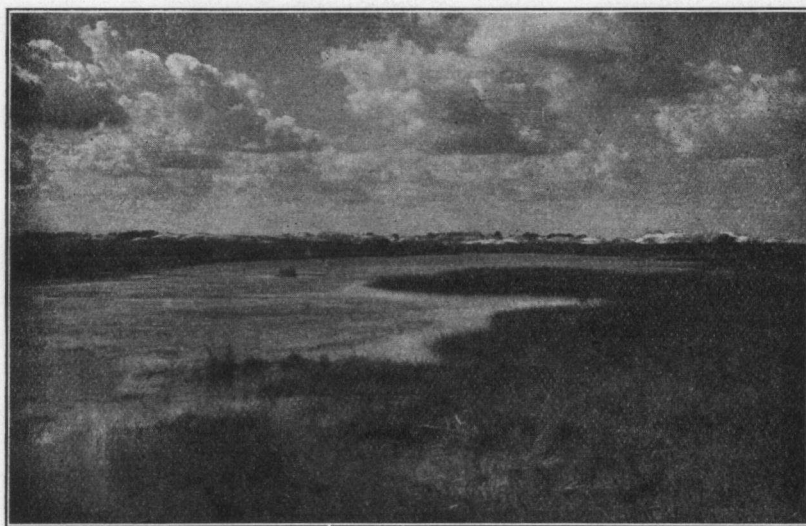
Gerrits-Flesch. Gezicht van het N. N. O. einde over het meertje Z. Z. W. waarts op het Harskampsche Zand.

5. Bij uitzondering zullen ook kaarten geldig voor meer dan één bezoek voor een persoon, al dan niet door een helper begeleid, worden uitgereikt. Het bepaalde bij de laatste alinea van Art. 3 en bij Art. 4 is van toepassing.