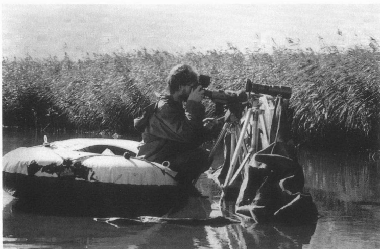
Moderne vogelaar en zijn "prooi".