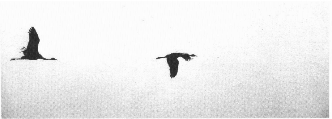
Kraanvogels, Paterswolde, maart 1998