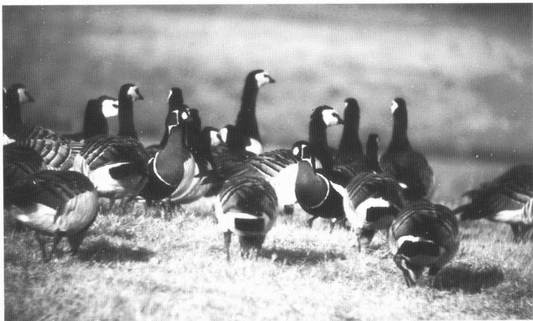
Roodhalsganzen, Bandpolder, maart 1998

De gehele periode werden naar schatting 10 tot 20 vogels gezien in het kustgebied. Bij de centrale op het oostelijk Eemshaventerrein werd in maart enkele keren een baltsend paartje gezien.