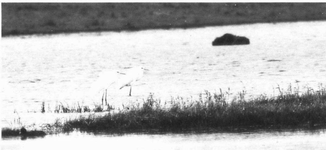
Grote Zilverreigers, Glimmermade, maart 1998,

31 jan 1 Lauwersmeer, Vlinderbalg 14 feb 1 Lauwersmeer, Vlinderbalg 21 maa 2 roepend, Kollumerwaard, 'Reigerkreek'