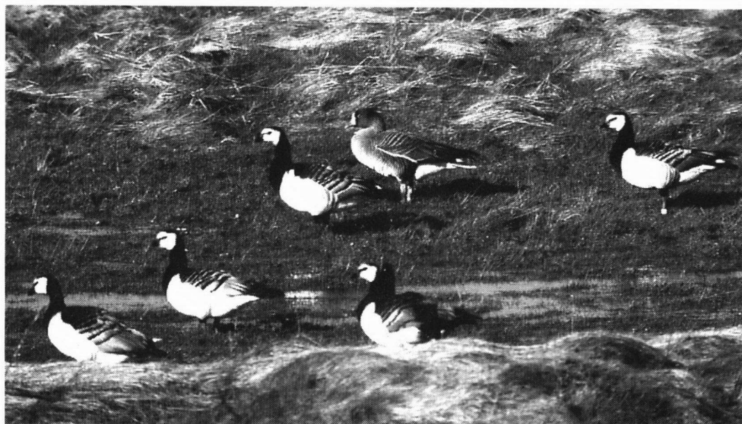
Dwerggans, Noordpolderzijl, 1 maart 1998,