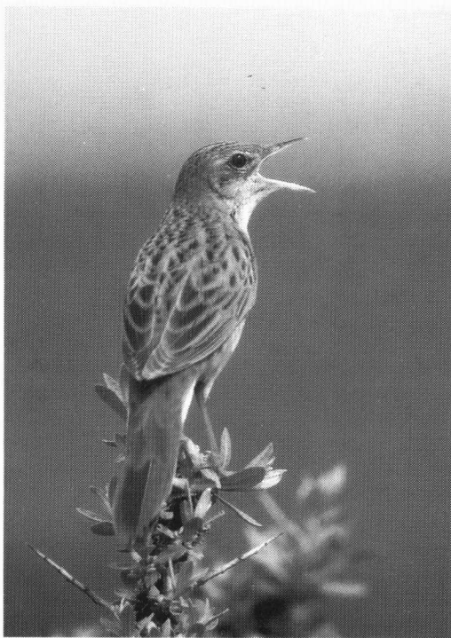
Sprinkhaanzanger, Eemshaven Eric Koops

De eersten werden begin februari gezien langs de Marnewaarddijk. Op 14 februari zat er een ♀ in de Reiderwolderpolder. Op 28 maart zaten er minimaal 10 vogels bij de Zoute Kwel.