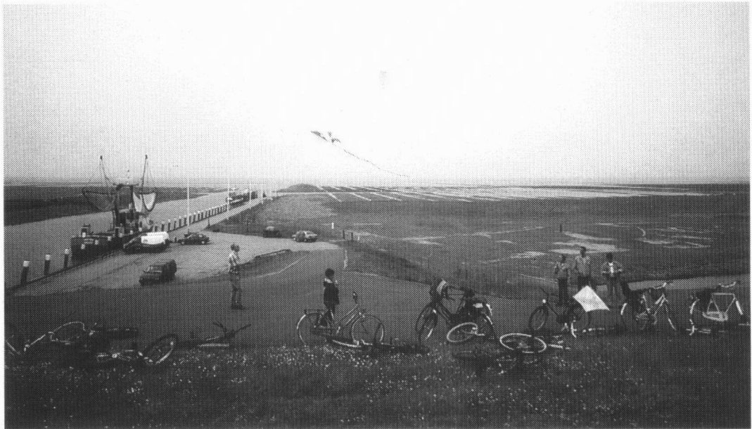
Vliegerwedstrijd bij Noordpolderzijl.

Jagers zijn in het najaar en de winter actief, en zorgen telkens voor veel onrust. Avifauna heeft hiertegen herhaaldelijk en op verschil-