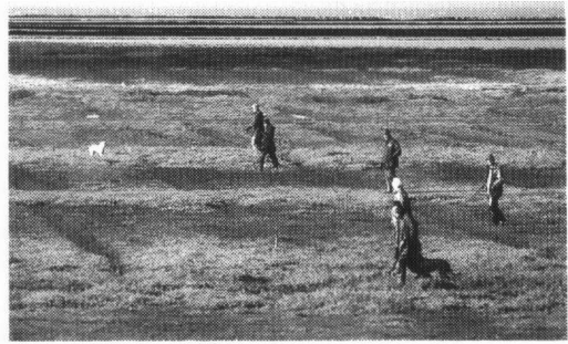
Jagers op de kwelder, nu niet meer actueel.

Piloten van sportvliegtuigjes lijken zich bijzonder aangetrokken te voelen tot de kust.