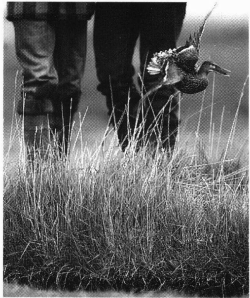
Onderzoekers stoten een broedende Slob-eend op.

En dan tenslotte de beweiding. Onze inventarisatie is een momentopname. Vaak wisselt het beeld per week. De ene boer schaart al vroeg in het seizoen honderden schapen in, een ander wacht daarmee tot de ganzen weg zijn, weer een ander kiest voor koeien of paarden of beweidt helemaal niet. Dit tamelijk willekeurige maar wel gevarieerde beheer heeft geleid tot een grote diversiteit van de