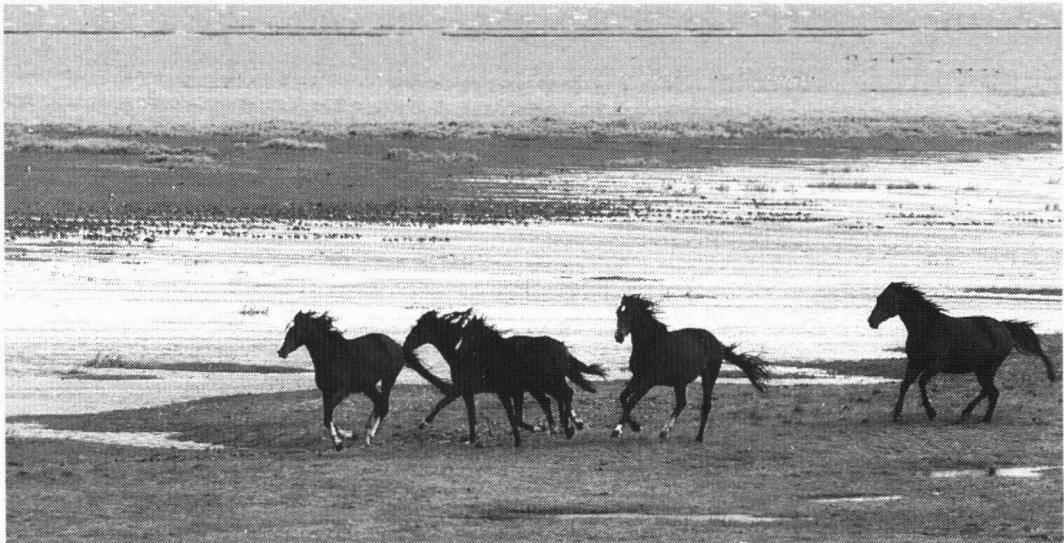
Paarden op de kwelder aan de Noordkust.

Daar staat echter tegenover dat er naar alle waarschijnlijkheid veel legsels verloren gaan door vertrapping door het vee (de Boer en Koks 1997). Factoren die hierbij een rol spelen zijn: het tijdstip in het jaar waarop het vee wordt ingeschaard, de hoeveelheid vee, het soort vee en de leeftijd van het vee.