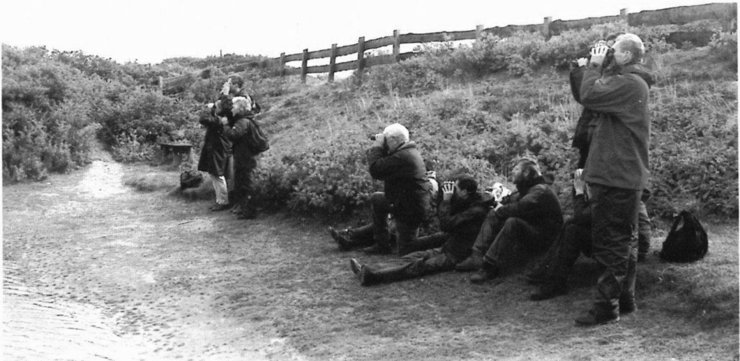
Leden van Avifauna bekijken een Pallas' Boszanger.

Al snel kwamen we bij het eerste plasje, met in het midden een met riet begroeid eilandje.