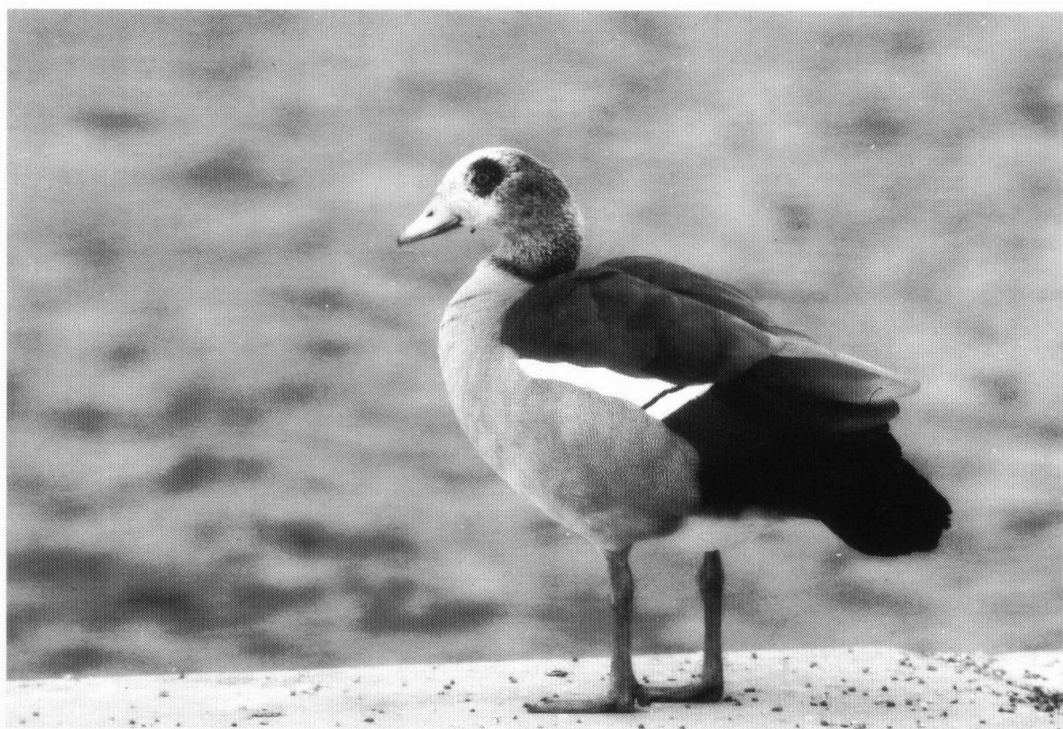
Nijlgans, Hoornse Meer.

In 1999 zaten in het telgebied 410 Soepganzen (tabel 1). Deze 'soort' komt welis-