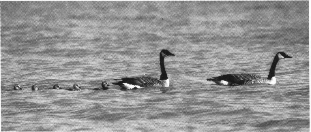
Het aantal Canadeze Ganzen neemt nog jaarlijks toe.

Zwaangansen kwamen 15 jaar geleden meer voor dan tegenwoordig (tabel 1). Toentertijd ging het om circa 20 vogels. De soort kwam oorspronkelijk uit het Boeremapark in Haren. In dit park kregen de ganzen ook jongen. De paar vogels die het park verlieten vestigden zich vooral in het Paterswoldsemeergebied en kruisten met de hier aanwezige Soepgansen. De laatste 5 tot 10 jaar komen er geen jongen meer groot in het Boeremapark. In dit gebied zitten tegenwoordig maar twee Zwaangansen. De populatie Soepgansen