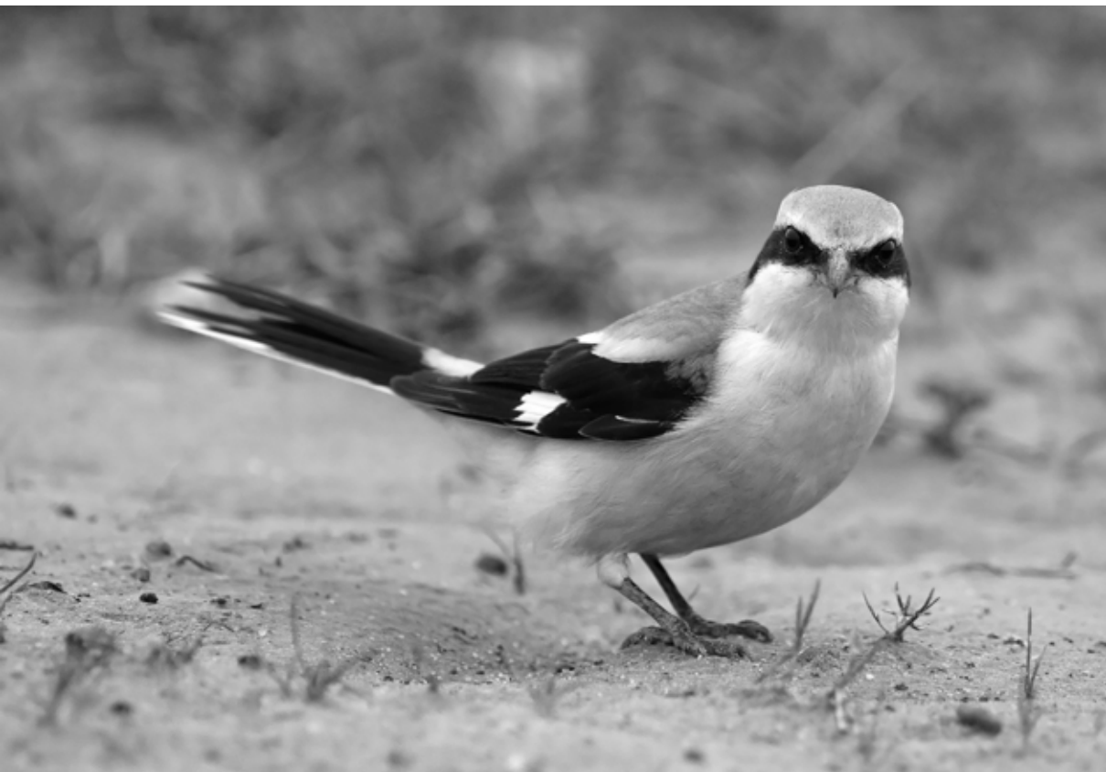
Klapekster – Blauwe Stad – 24 februari 2008