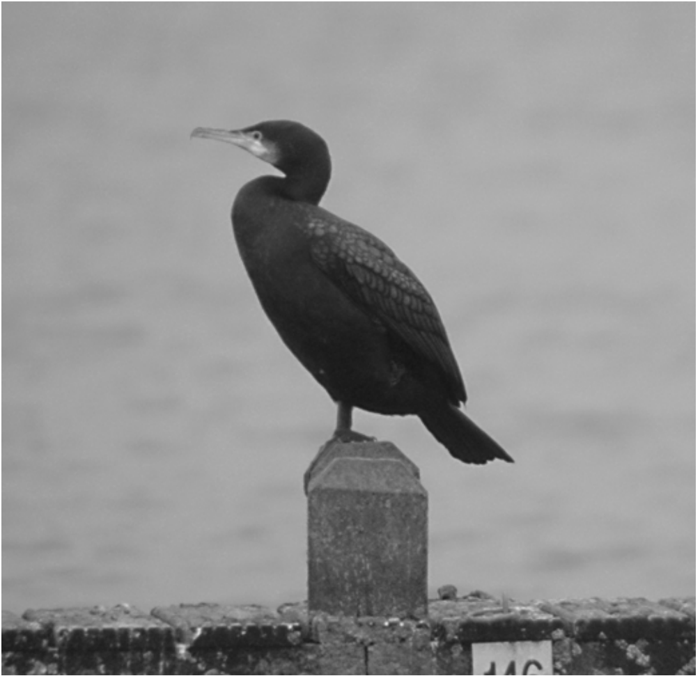
Grote Aalscholver – Groningen – 6 januari 2008

Indien aanvaard betreft het hier een nieuwe ondersoort voor de provincie Groningen.