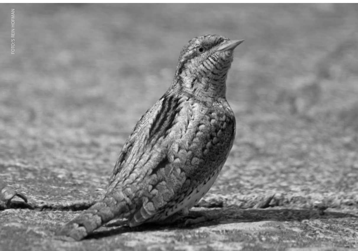
Draaihals – Borgsweer – 21 april 2008