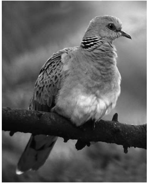
Zomertortel – Sappemeer – 16 augustus 2005

Zomertortels te horen. In de laatste week van mei is de activiteit het grootst. Het doordringende turrrr-turrrr is vooral 's ochtends vaak te horen, maar overdag kun je de vogels ook horen.