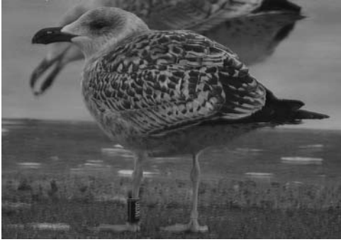
Grote Mantelmeeuw (JX00) Denemarken – 21 november 2008

Visdieven met een Afrikaanse ring in Lauwersoog gezien. Op 23 augustus 2008 zag Derick Hiemstra deze vogel in de haven van Lauwersoog en het lukte hem om de metalen ring met de telescoop af te lezen.