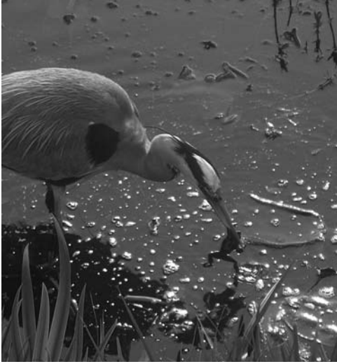
Figuur 1. De foto is van een volwassen Blauwe Reiger die op 19 april 2007 in de vijver een kikker ving.

de Hunze was ter plaatse geheel open. Daar hadden zich de weinige eenden die nog aanwezig waren teruggetrokken, waaronder een vijftiental Wilde Eenden. Deze waren bezig zwemmend langs de rietkraag te foerageren. Een mannetje dat spartelende bewegingen met zijn snavel maakte, bleek een kikker gevangen te hebben. Hoe dit gebeurde hebben wij niet gezien. Evenals bij de reiger werd de kikker door de eend langdurig in de snavel