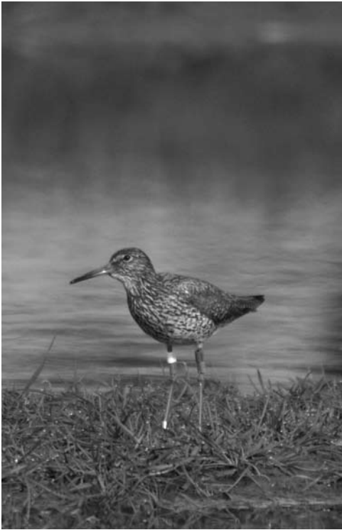
Tureluur – Ellerhuizen – 17 mei 2010

weilanden bij Middelstum als verse plukrest van een roofvogel.