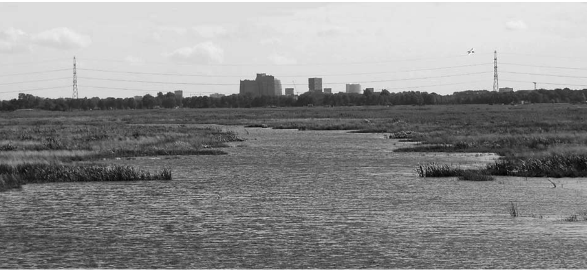
Zuidelijke slenk in de Matslootpolder, richting oost vanaf de Hooiweg