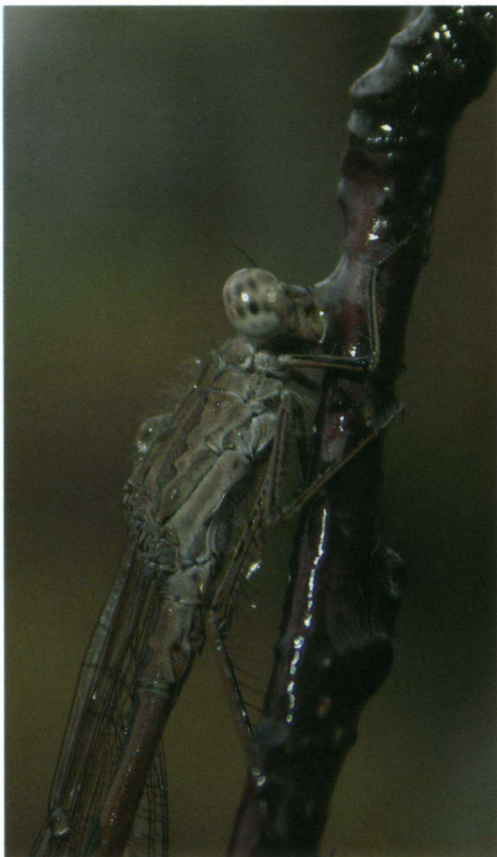
Figuur 4 Noordse winterjuffer ( Sympetma paedisca ) (♂) bedekt met gesmolten rijp (ijswater). Sympetma paedisca (♂) covered with icewater.

goede schutkleur. In herfst, winter en voorjaar is de kleur veranderd naar lichtbruin met bronskleurige donkere delen (MANGER, 2007); dieren op berkentakjes vallen dan nog nauwelijks op.